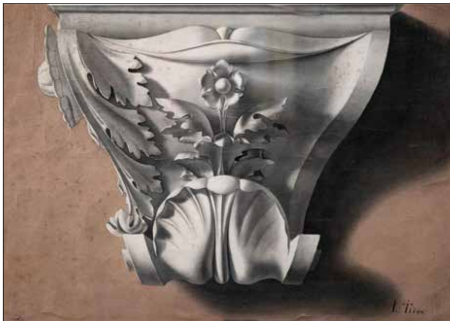
Kapitel stupa I, grisaille na papiru, 44 x 53 cm