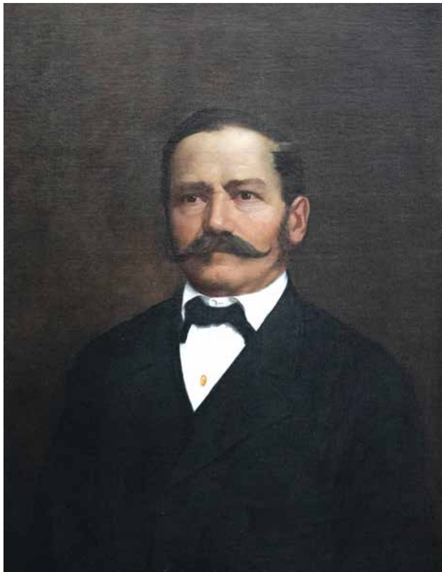
Franjo Jakševac , ulje na platnu, 78 x 61 cm