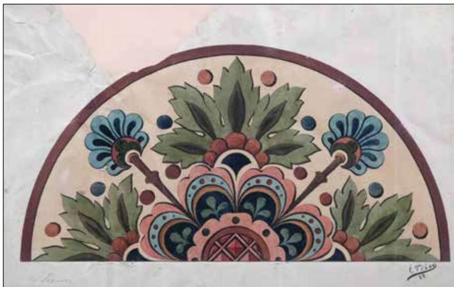
Ukras, gvaš na papiru, 42 x 64 cm (1887.)