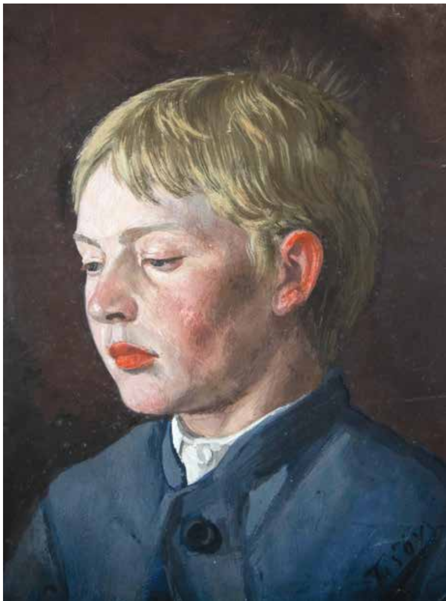
Portret dječaka, ulje na kartonu, 40 x 30 cm (1888.)