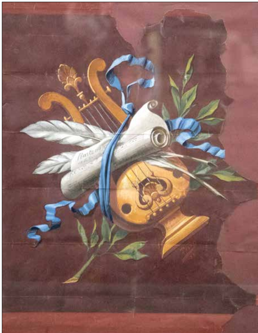
Harfa s notama, gvaš na papiru, 63 x 50 cm (1888.)