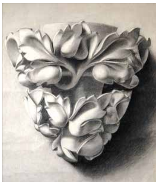
Glavica stupa, grisaille na papiru, 51 x 36 cm