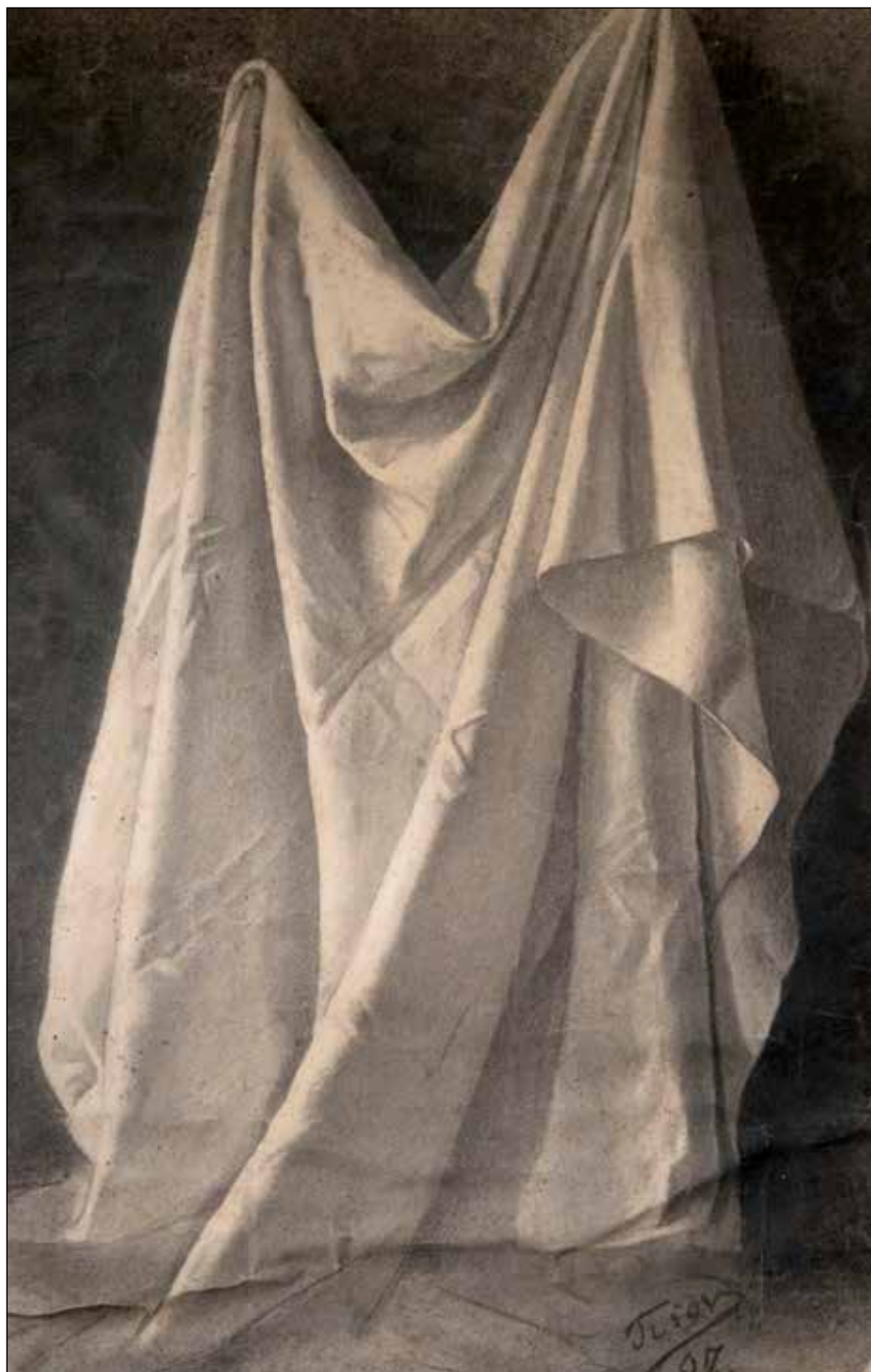
Platno, crtež olovkom, 62 x 38 cm (1887.)