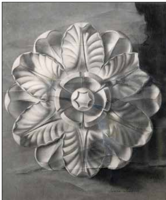
Cvijet na zidu, grisaille na papiru, 55 x 45 cm