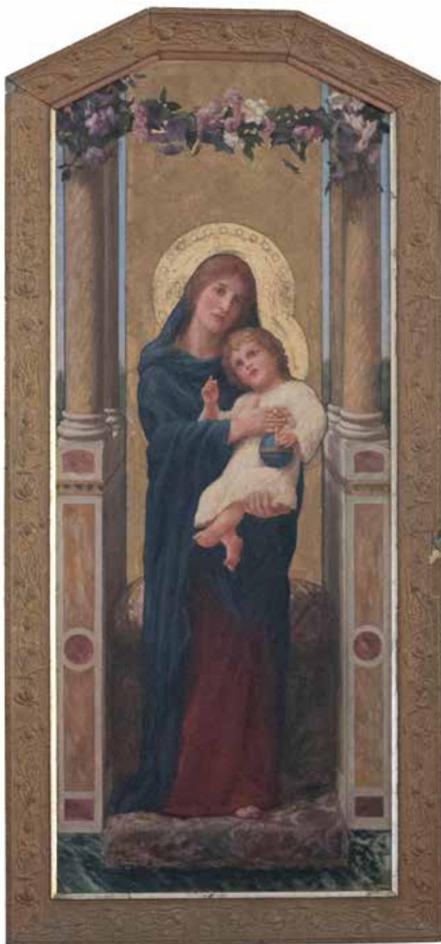
Marija s Isusom, ulje na drvetu, 137 x 55 cm