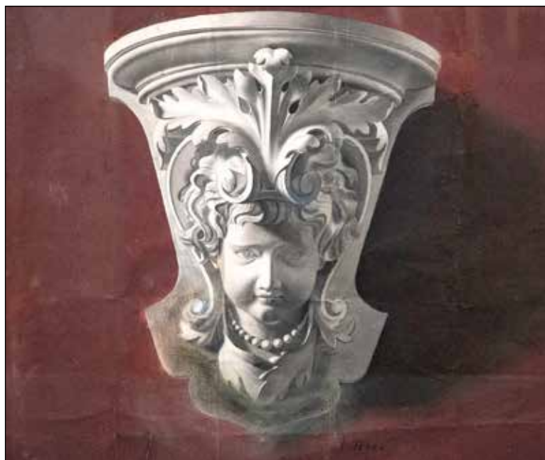
Kapitel stupa II, grisaille na papiru, 43 x 45 cm