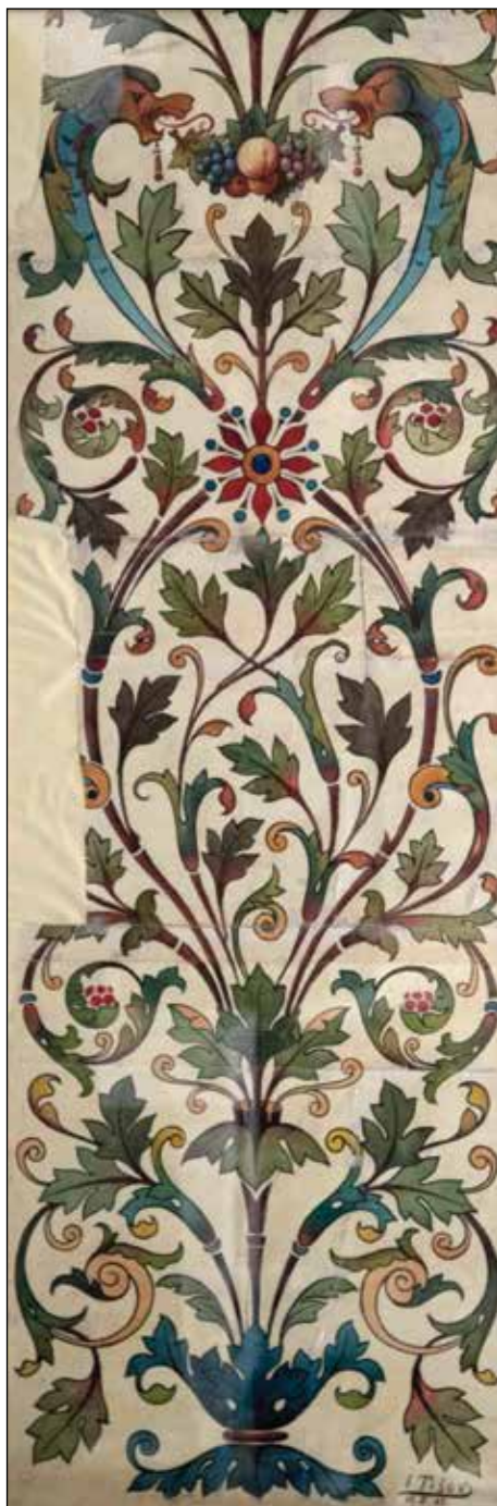
Antependij (ukrasni zastor), gvaš na papiru, 140 x 48 cm (1887.)