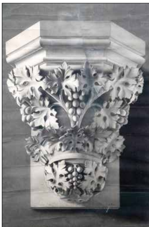
Stup (s grožđem), grisaille na papiru, 87 x 58 cm