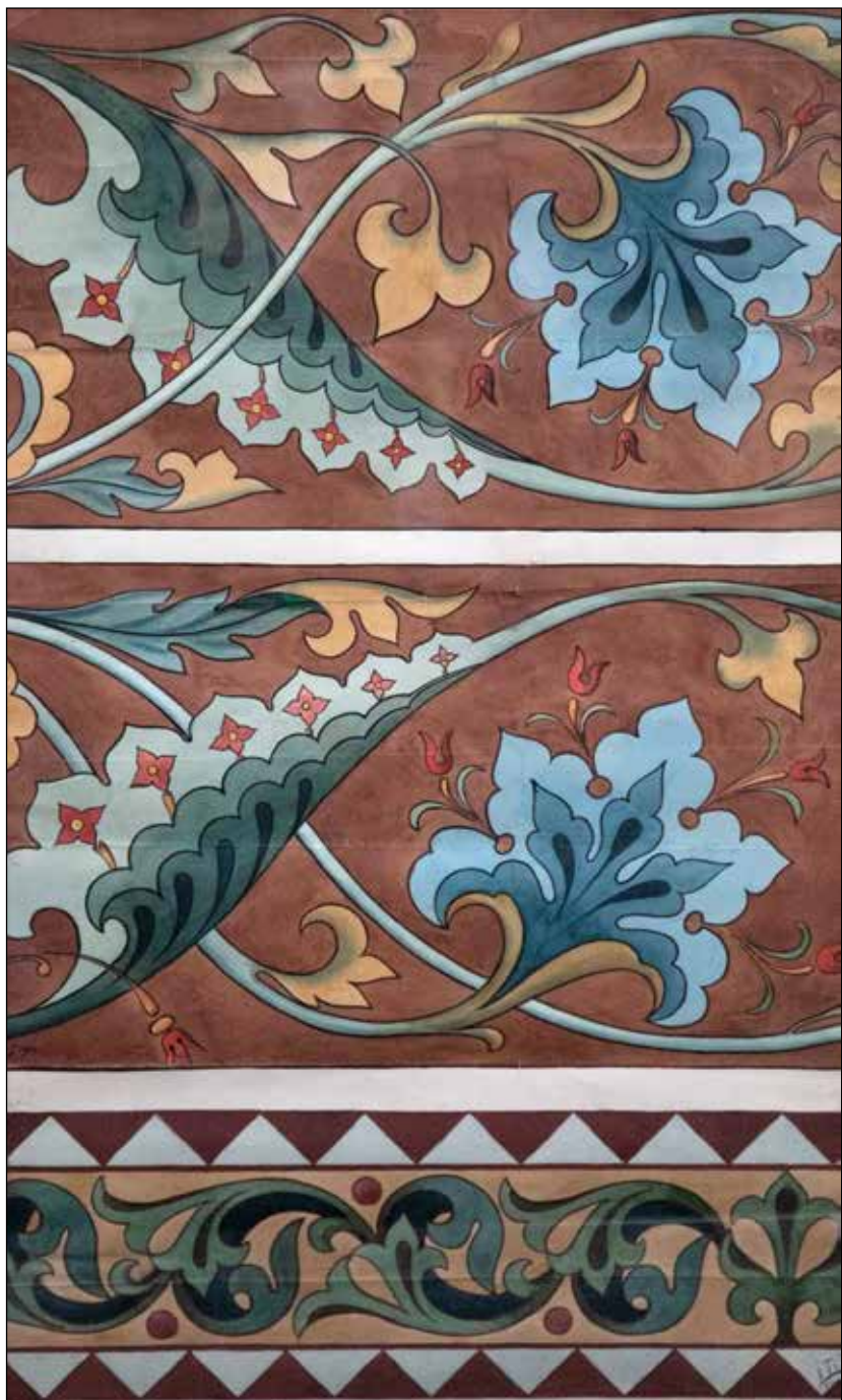
Ukras II, gvaš na papiru, 87 x 53 cm (1886.)