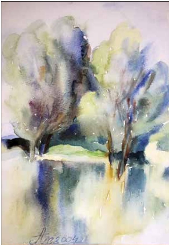
19. Razliveni pogled akvarel, 37 x 26 cm, 2004.