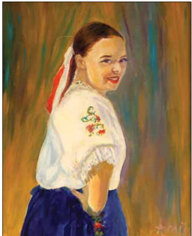
32. Barbara ulje na platnu, 48 x 39 cm, 2024.