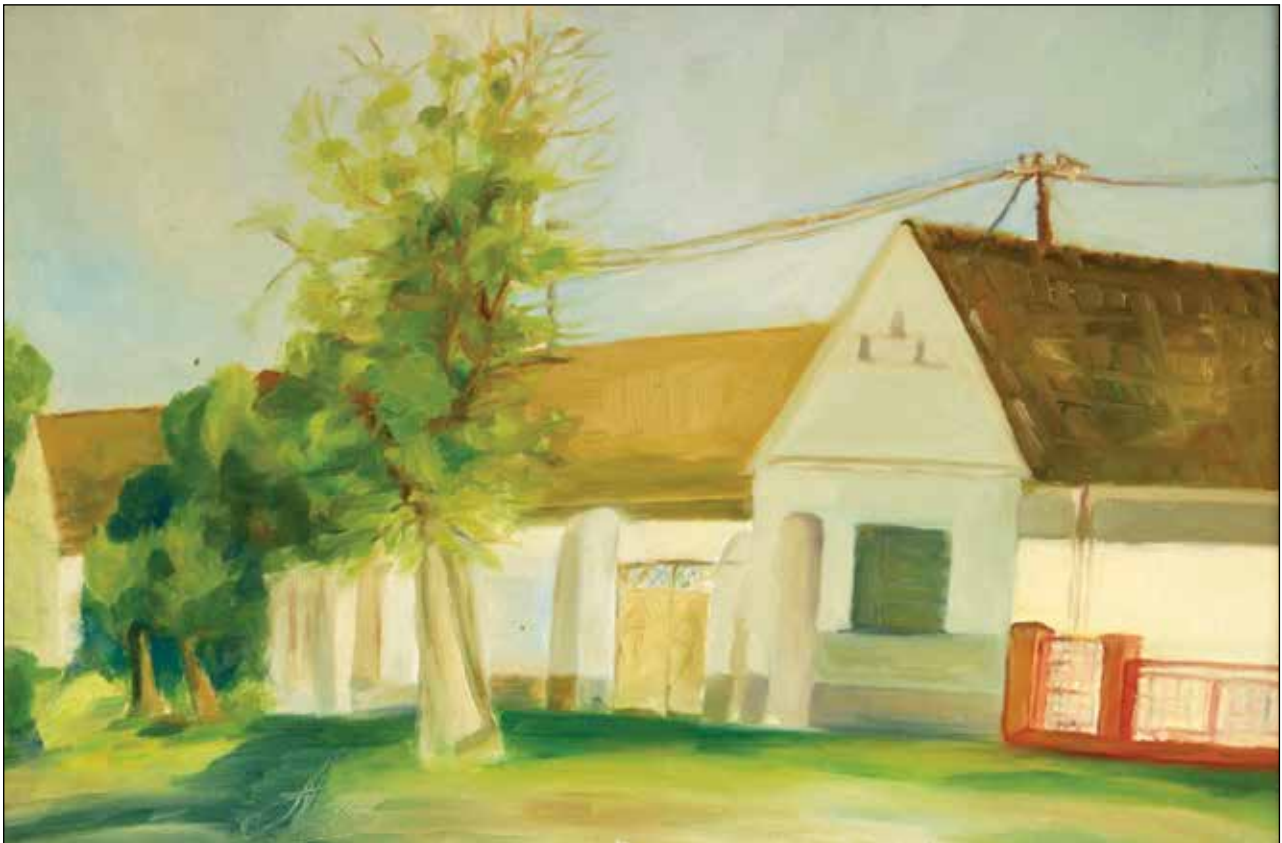
23. Stare kuće u Jurjevcu ulje na platnu, 40 x 60 cm, 2009.