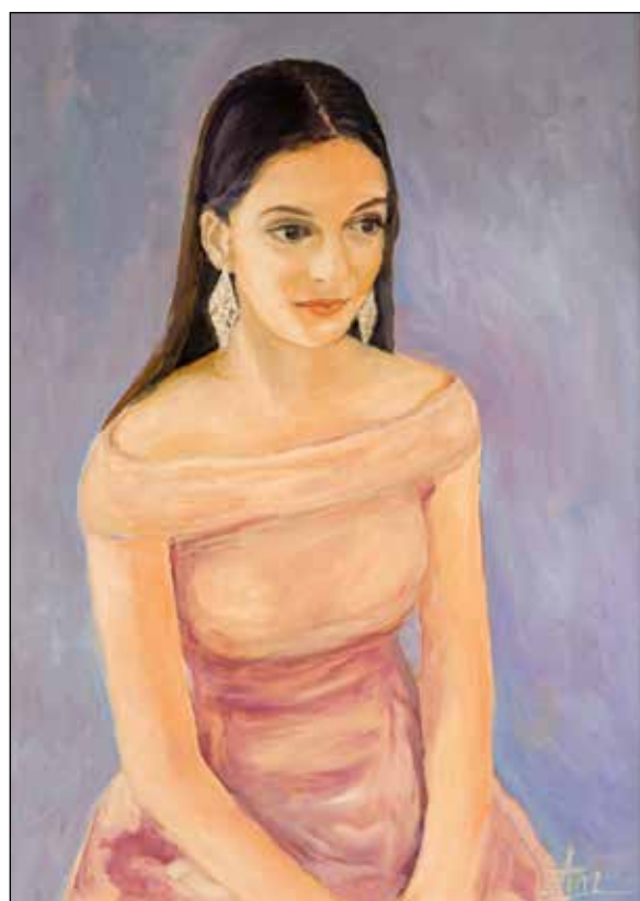
36. Jana ulje na platnu, 69 x 49 cm, 2010.