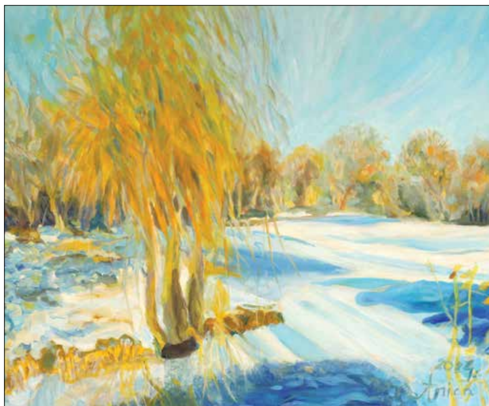
30. Zima na ribnjaku ulje na platnu, 50 x 60 cm, 2024.