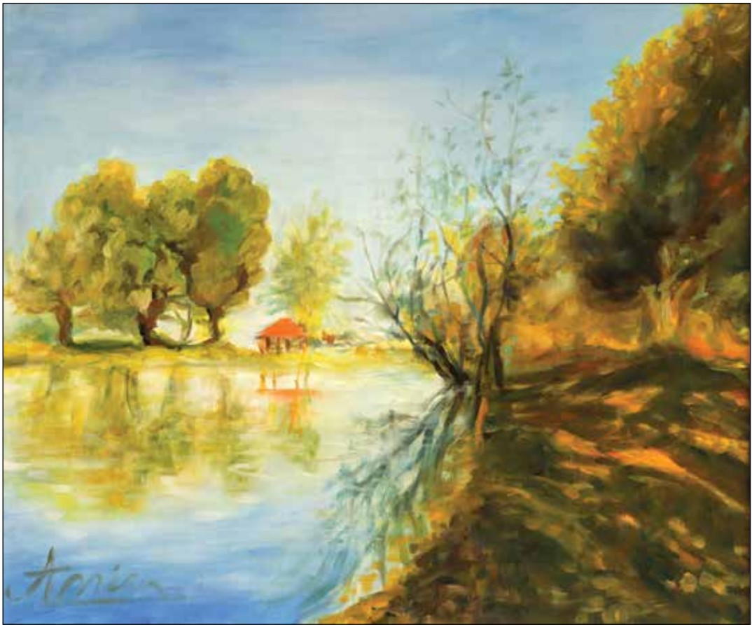
21. Ribnjak u Punitovcima ulje na platnu, 50 x 60 cm, 2024.