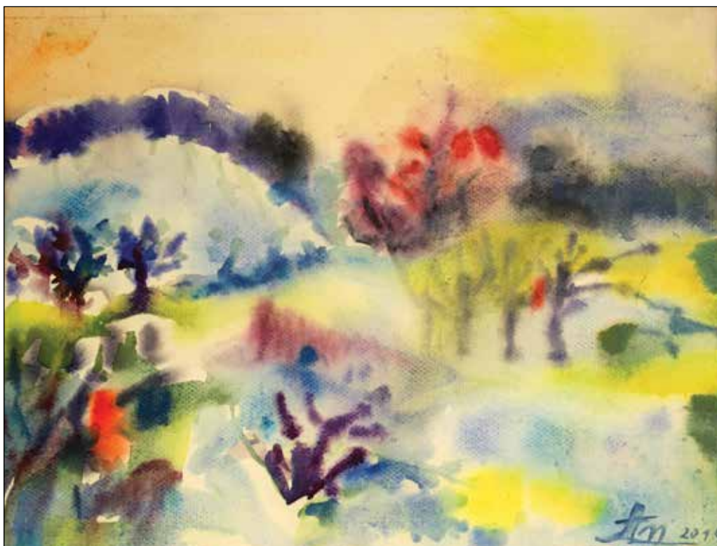
16. Polje akvarel, 30 x 38 cm, 2018.