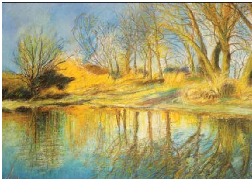
7. Jesen u Drljaku suhi pastel, 45 x 65 cm, 2019.