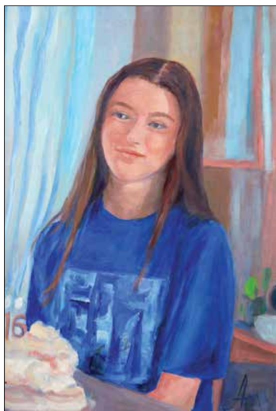
35. Hana II ulje na platnu, 40 x 60 cm, 2026.