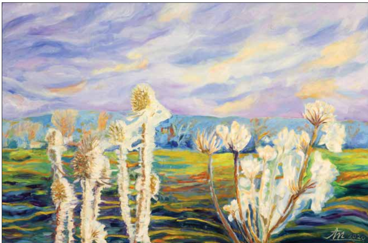
15. Ples u polju ulje na platnu, 80 x 120 cm, 2017.