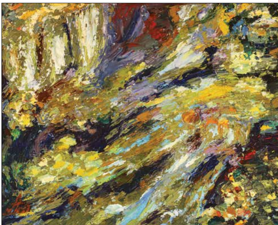
28. Voda ulje na platnu, 39 x 48 cm, 2004.