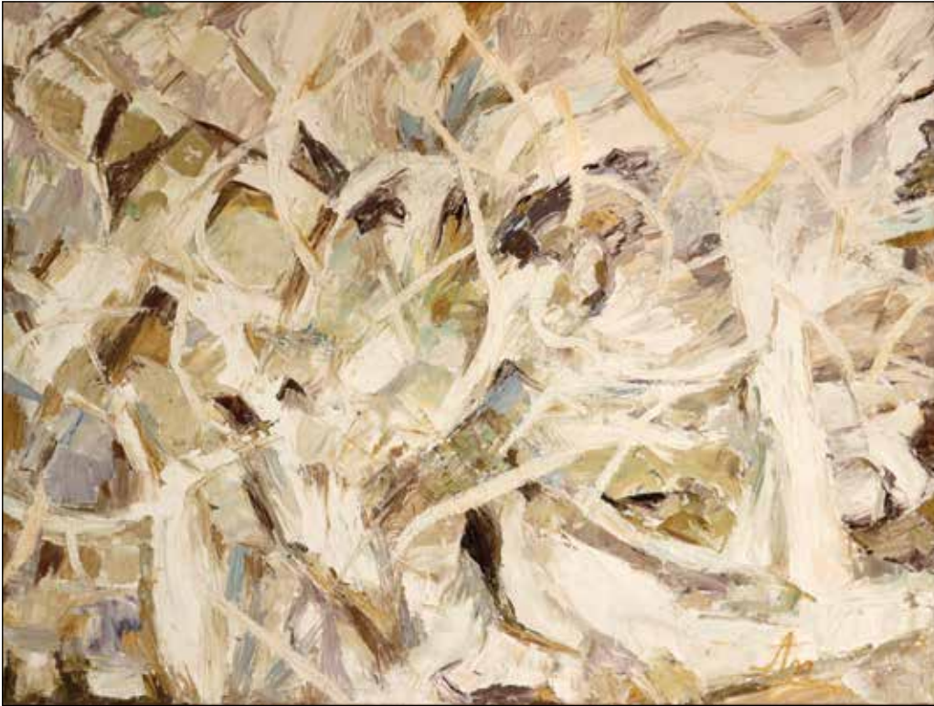
1. A čo je to? ulje na platnu, 60 x 80 cm, 2008.