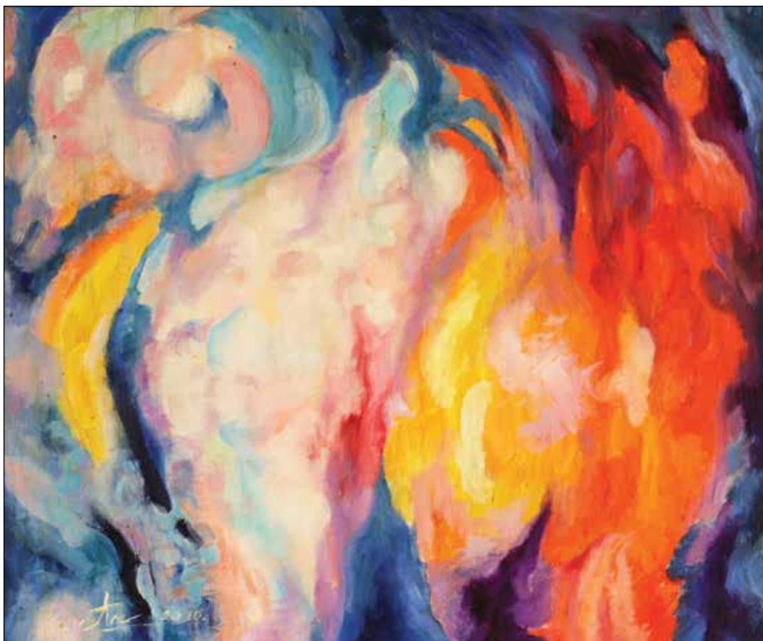
29. Voda i vatra ulje na platnu, 50 x 70 cm, 2020.