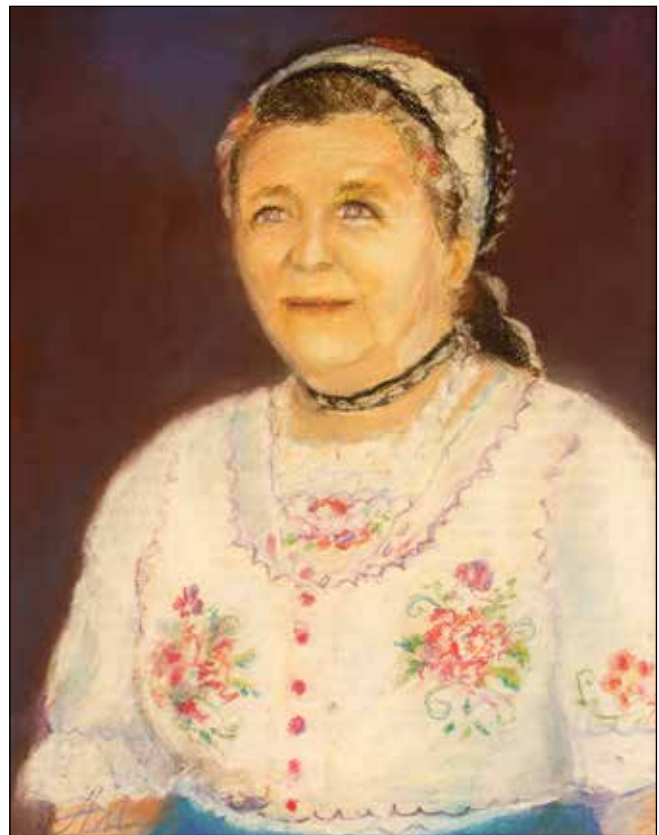
44. Tonka suhi pastel, 41 x 31 cm, 2018.