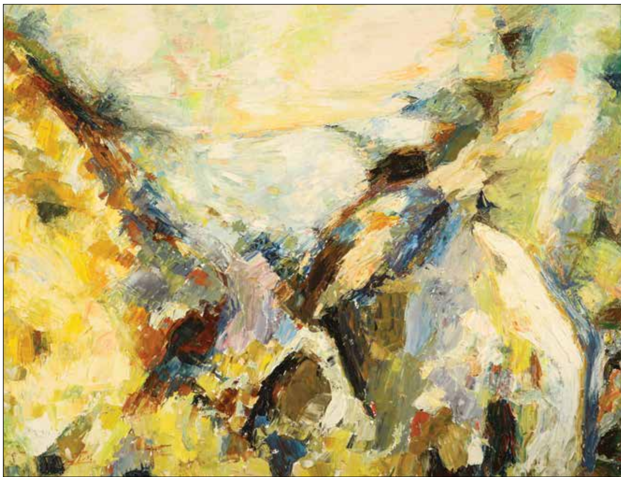
27. Suša na ribnjaku – panjevi su izronili iz vode ulje na platnu, 80 x 100 cm, 2007.