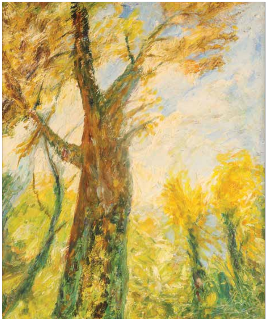
6. Jedno drvo ulje na platnu, 60 x 50 cm, 2017.