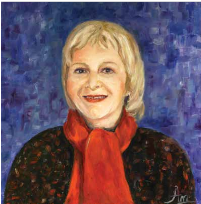
33. Branka ulje na platnu, 50 x 50 cm, 2017.