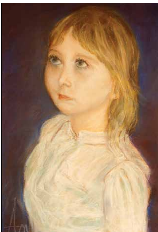
46. Zara suhi pastel, 44 x 31 cm, 2014.