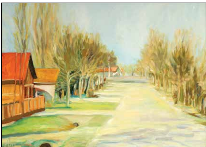
8. Jurjevac ulje na platnu, 50 x 70 cm, 2021.