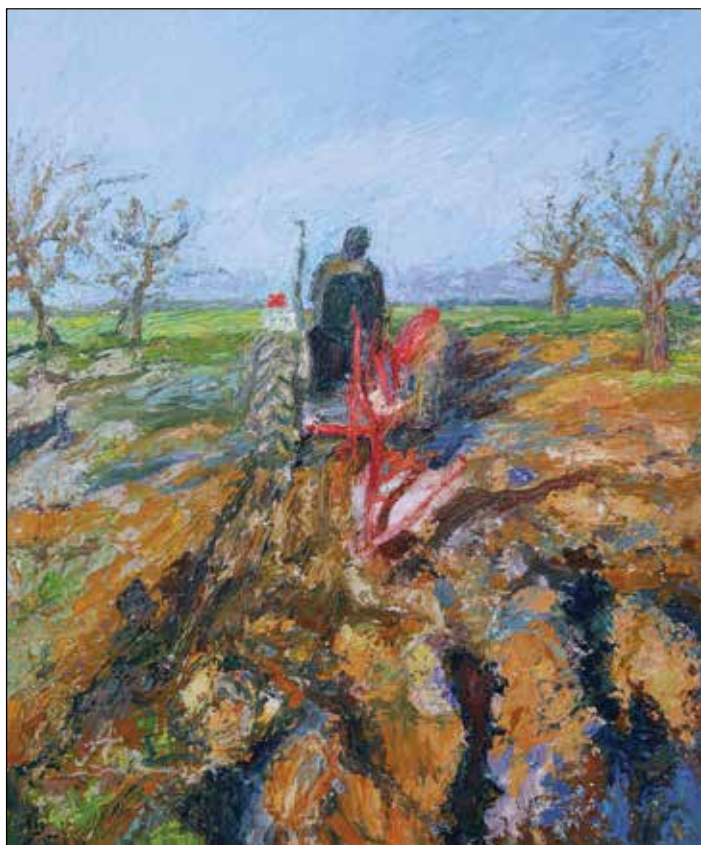
18. Proljetno oranje ulje na platnu, 60 x 50 cm, 2026.