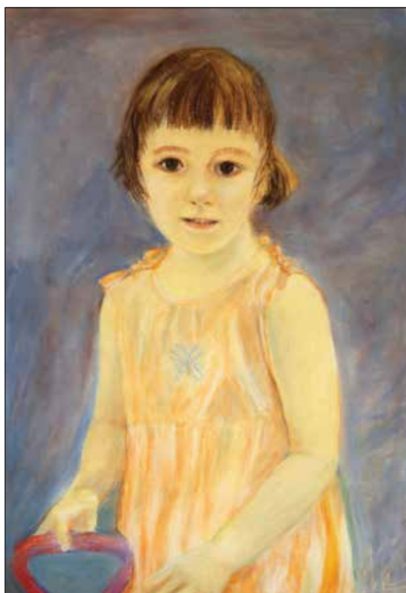
34. Hana I suhi pastel, 61 x 42 cm, 2007.