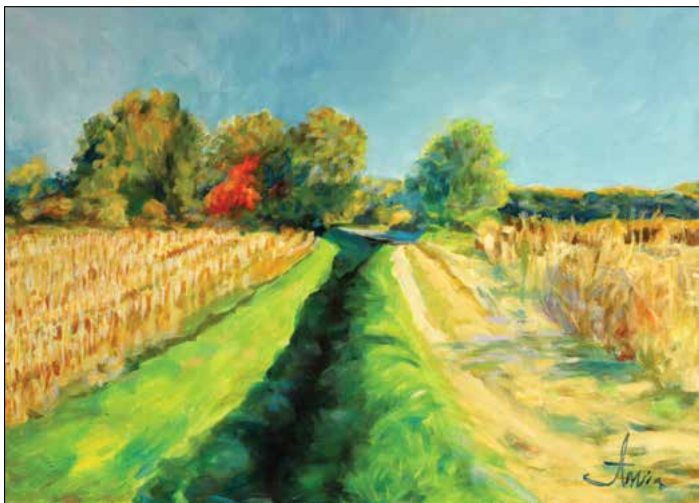
4. Iza prve lenije – ljeto ulje na platnu, 70 x 50 cm, 2025.