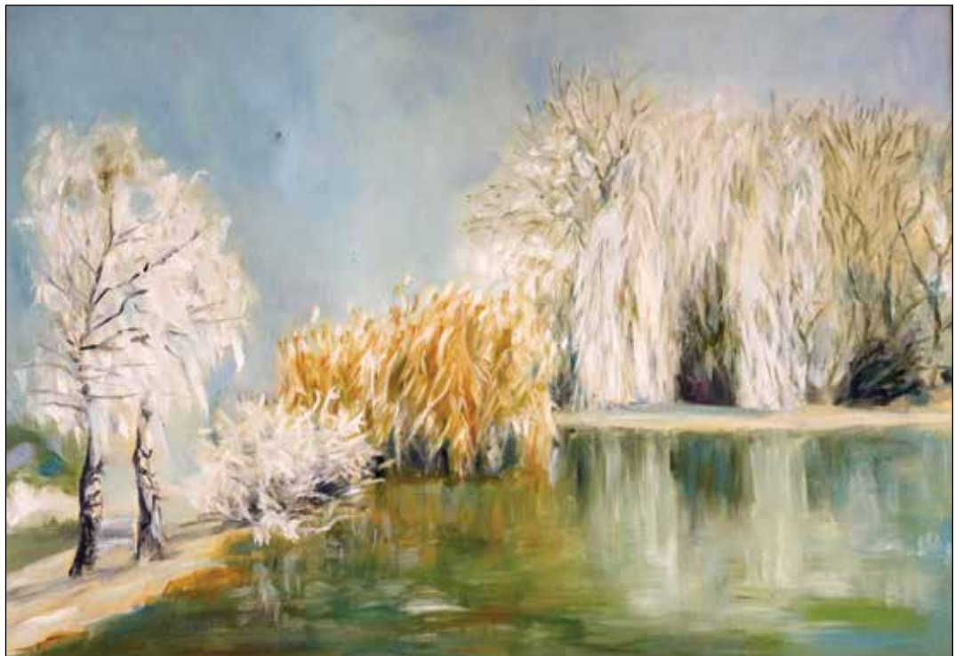
2. Bijele vrbe u Drljaku ulje na platnu, 50 x 70 cm, 2014.