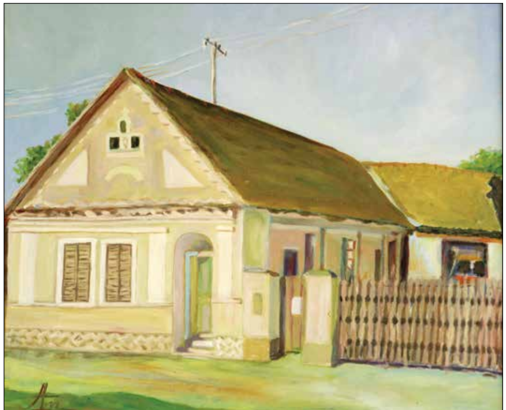
22. Stara kuća u Josipovcu ulje na platnu, 50 x 50 cm, 2014.