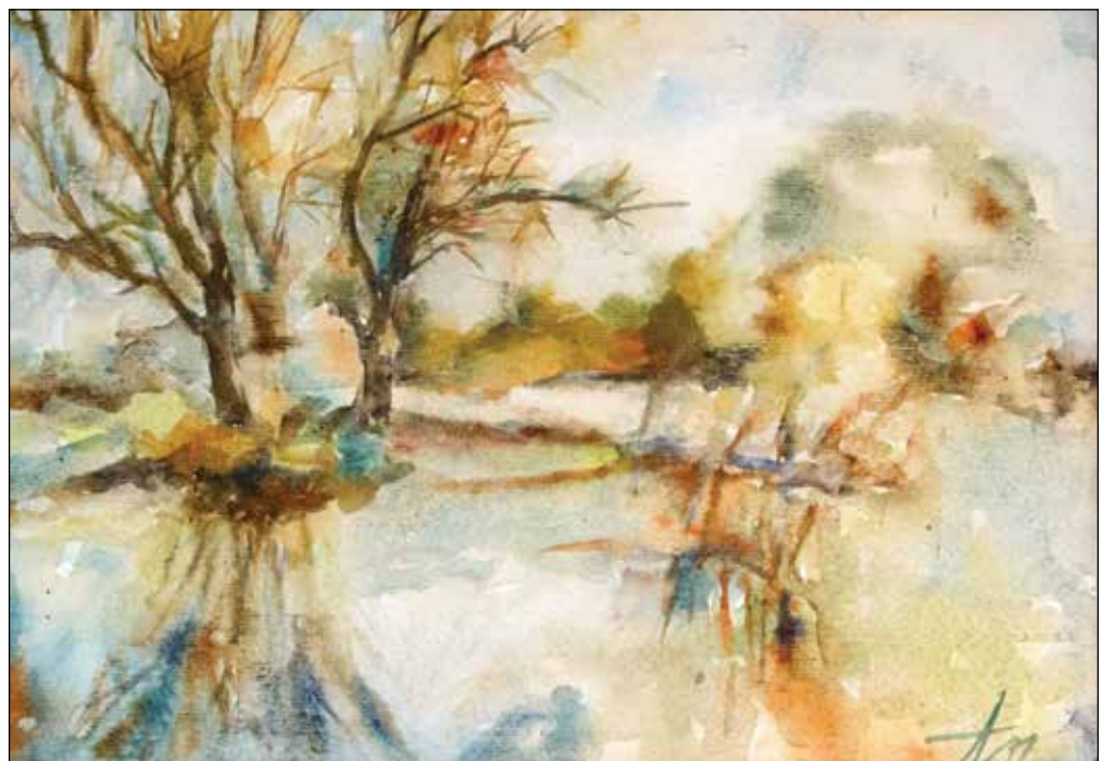
20. Ribnjak u Drljaku akvarel, 21 x 31 cm, 2007.