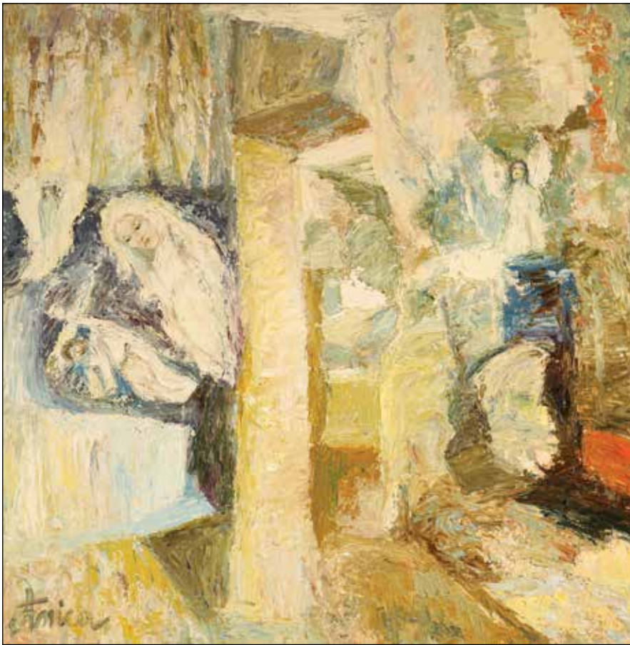
37. Majka žalosna prati svoga sina na križnom putu ulje na platnu, 70 x 70 cm, 2020.