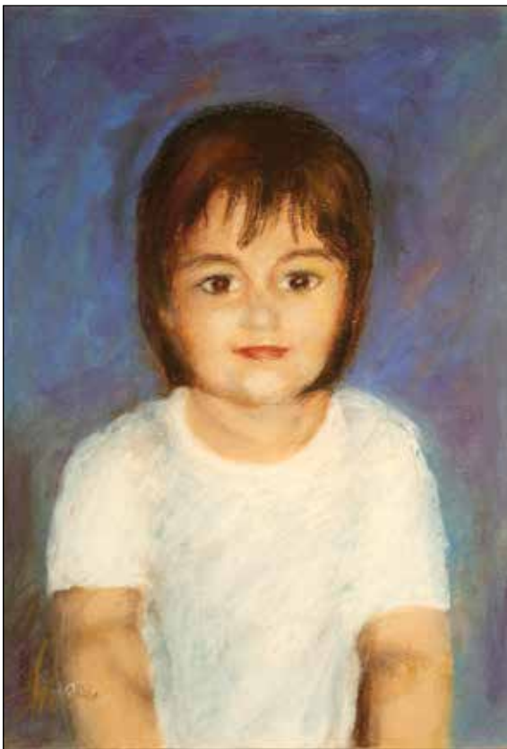
43. Tea suhi pastel, 40 x 28 cm, 2007.