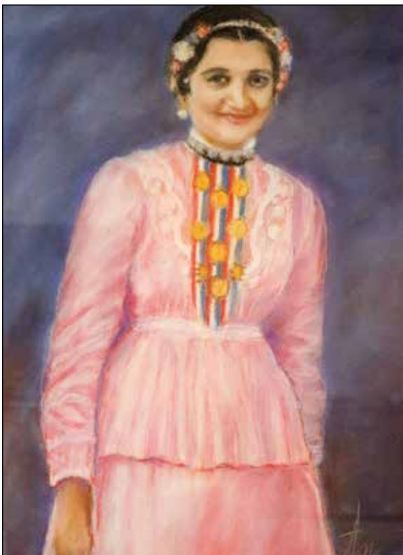
38. Marija iz Punitovaca suhi pastel, 56 x 40 cm, 2019.