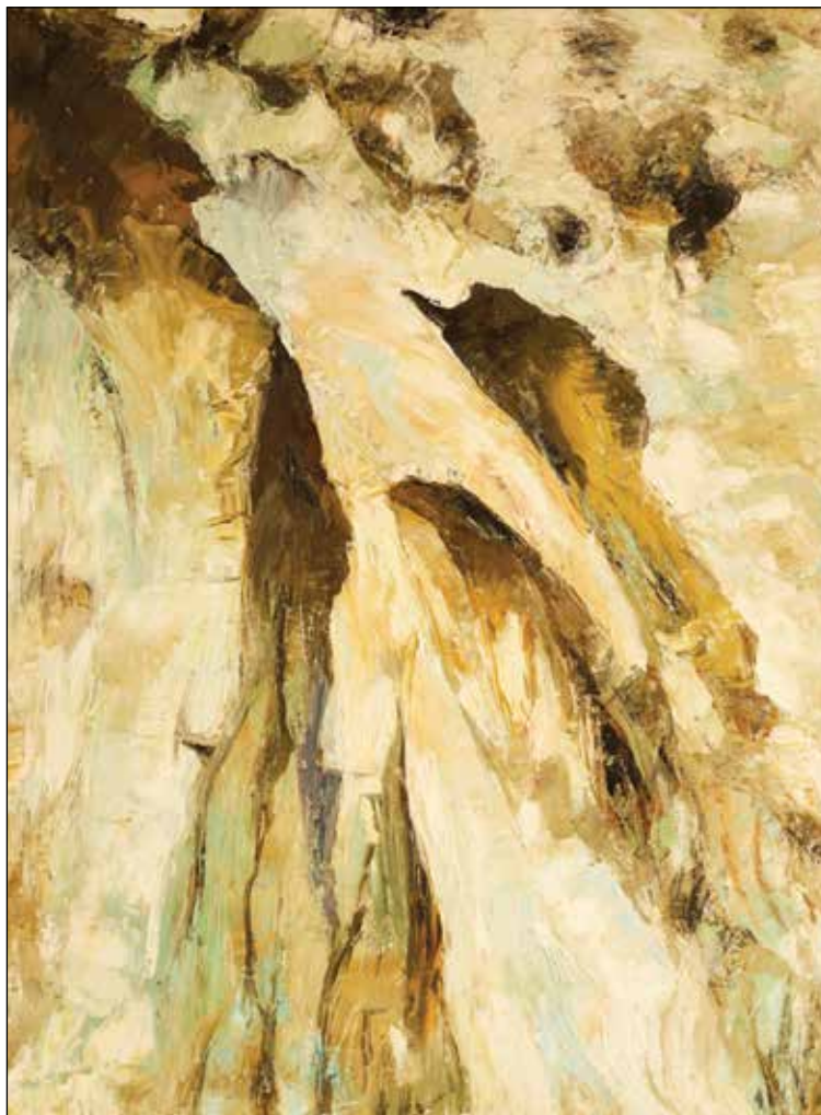
17. Posljednje razdoblje života jednog stabla ulje na platnu, 60 x 80 cm, 2012.