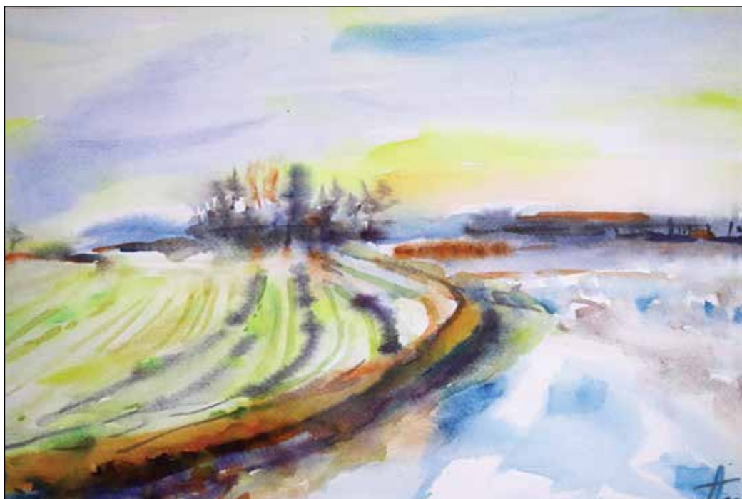
3. Iza prve lenije akvarel, 31 x 47 cm, 2020.