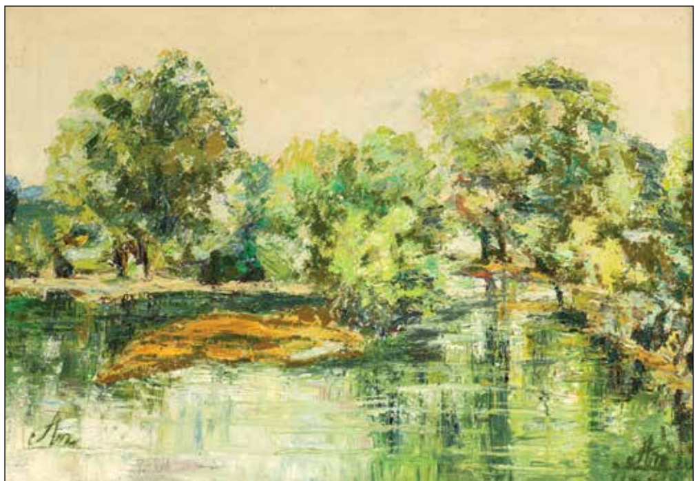
12. Ljeto u Drljaku III ulje na platnu, 49 x 69 cm, 2006.