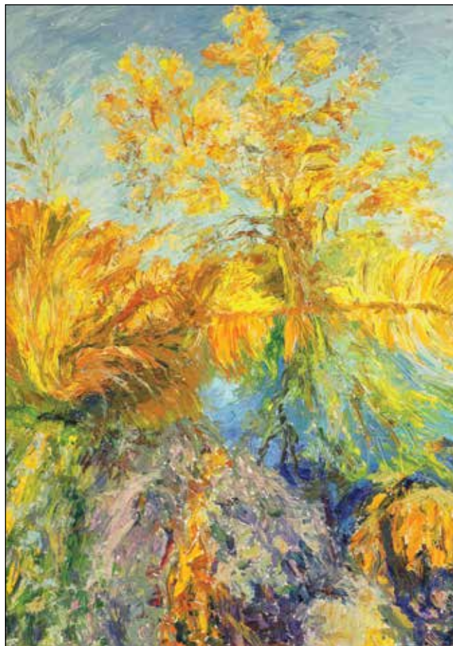
25. Sunce je promijenilo boje ulje na platnu, 70 x 50 cm, 2025.