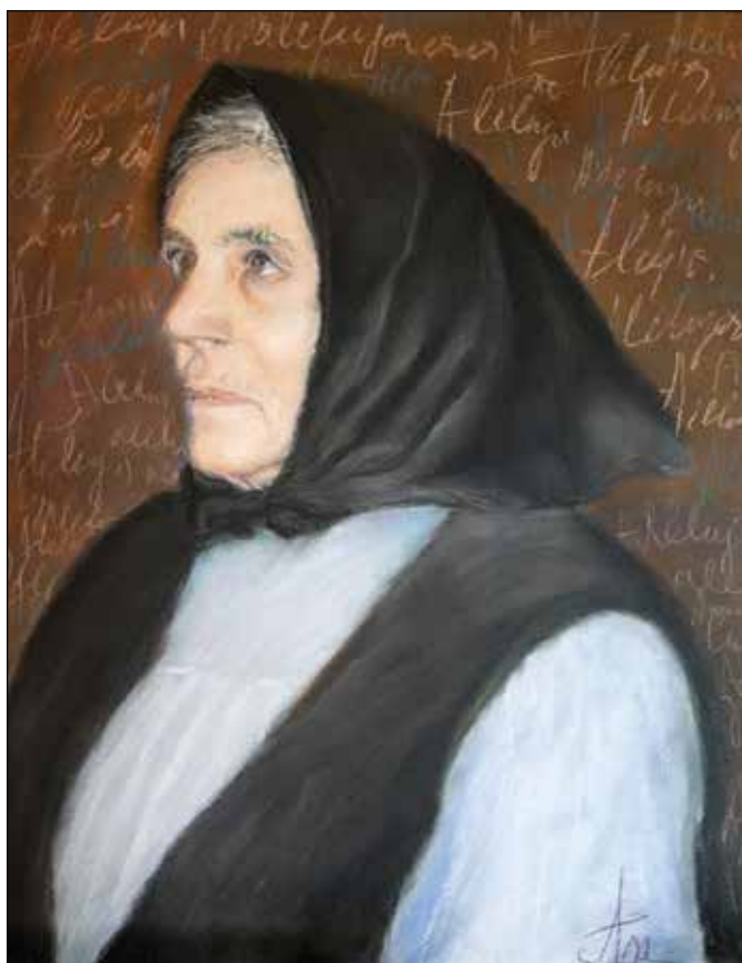
41. Pjevačica Ivica suhi pastel, 46 x 36 cm, 2016.