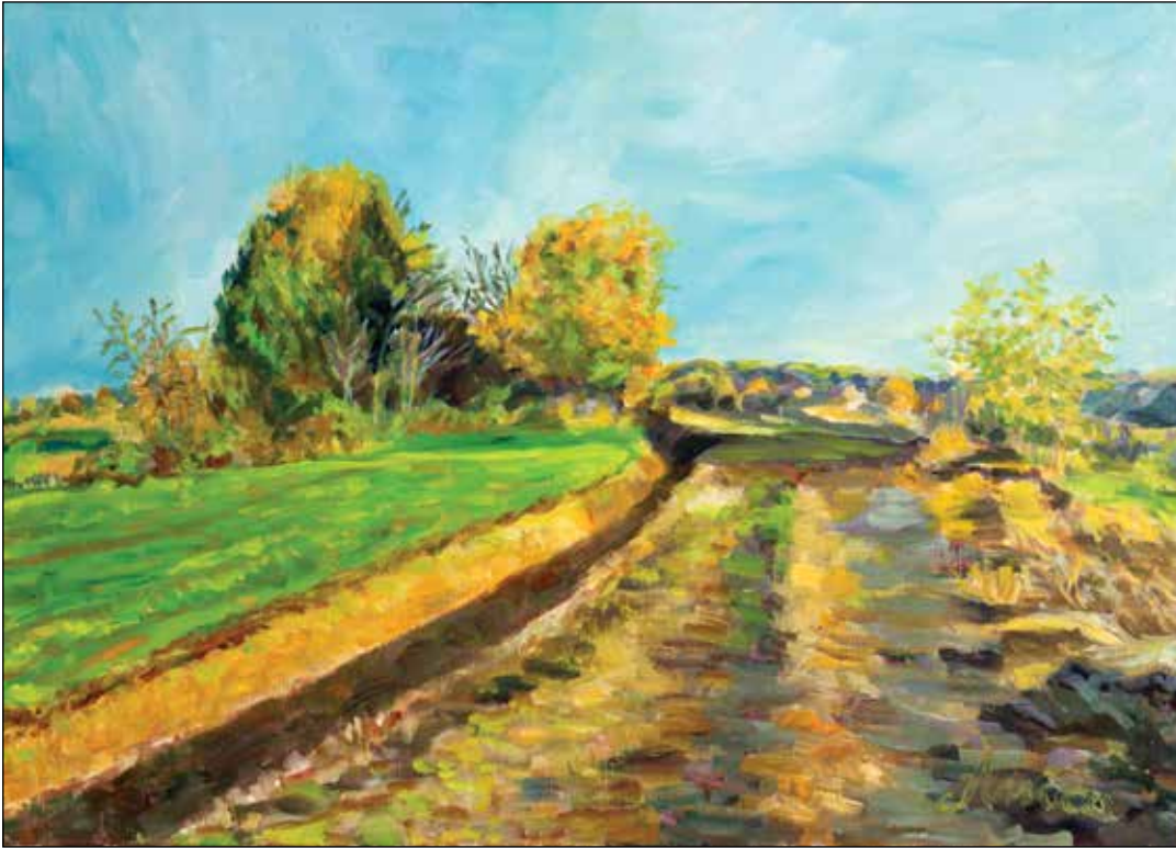
5. Iza prve lenije – jesen ulje na platnu, 70 x 50 cm, 2026.