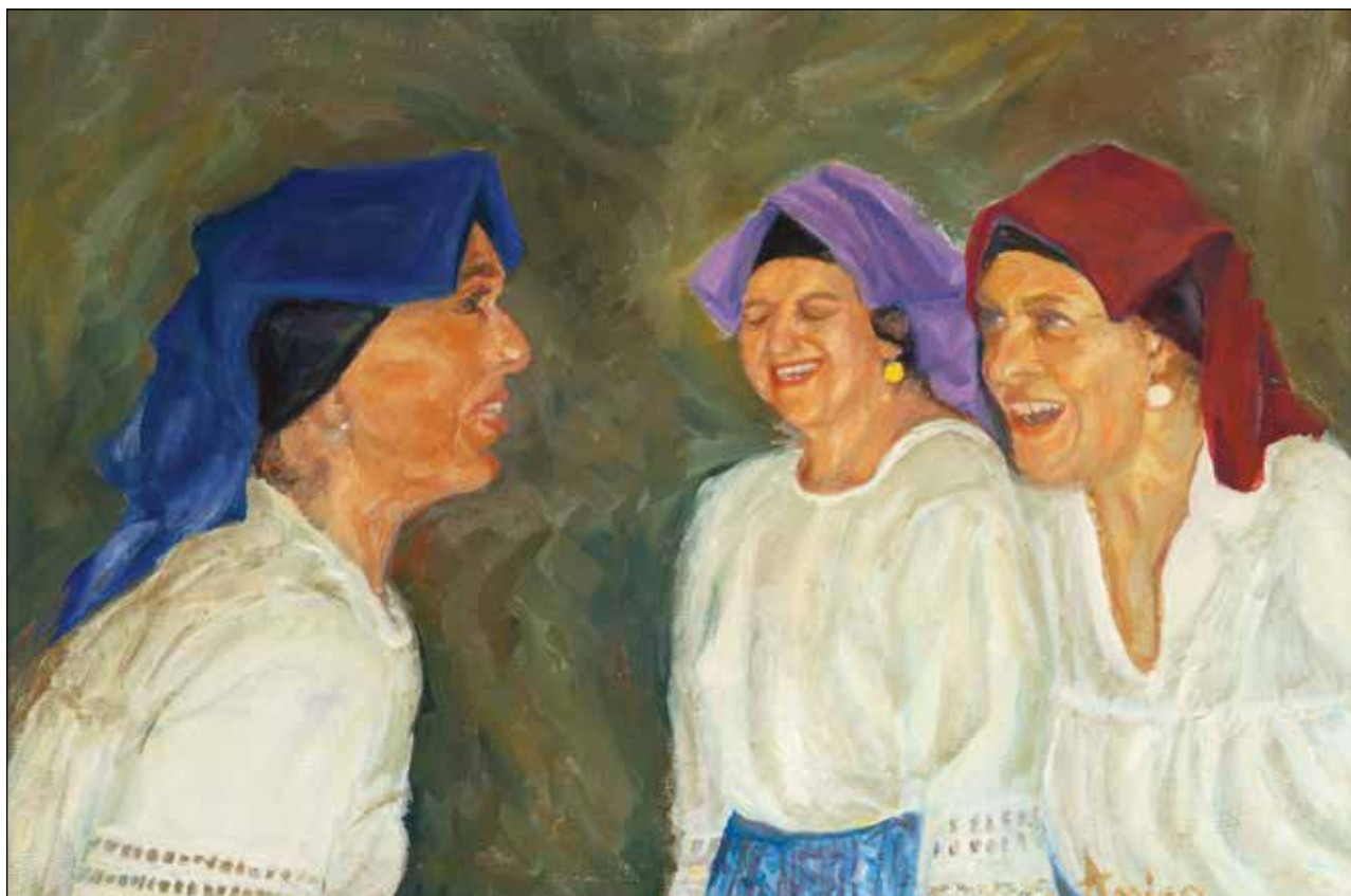
45. Vesele Punitovčanke ulje na platnu, 49 x 69 cm, 2025.