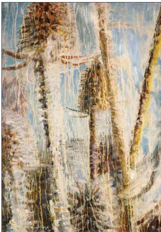
26. Sunce sja, mraz s čička nestaje ulje na platnu, 70 x 50 cm, 2018.