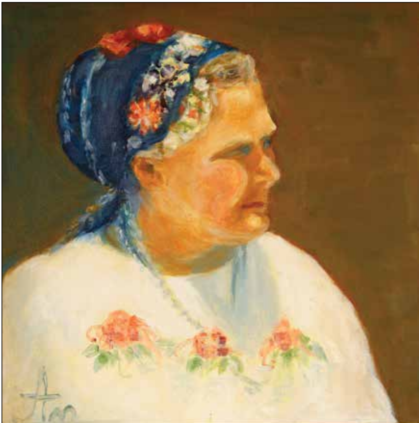
42. Roza ulje na platnu, 30 x 29 cm, 2017.