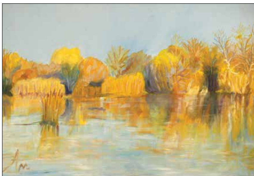
9. Kasna jesen u Drljaku ulje na platnu, 30 x 60 cm, 2020.