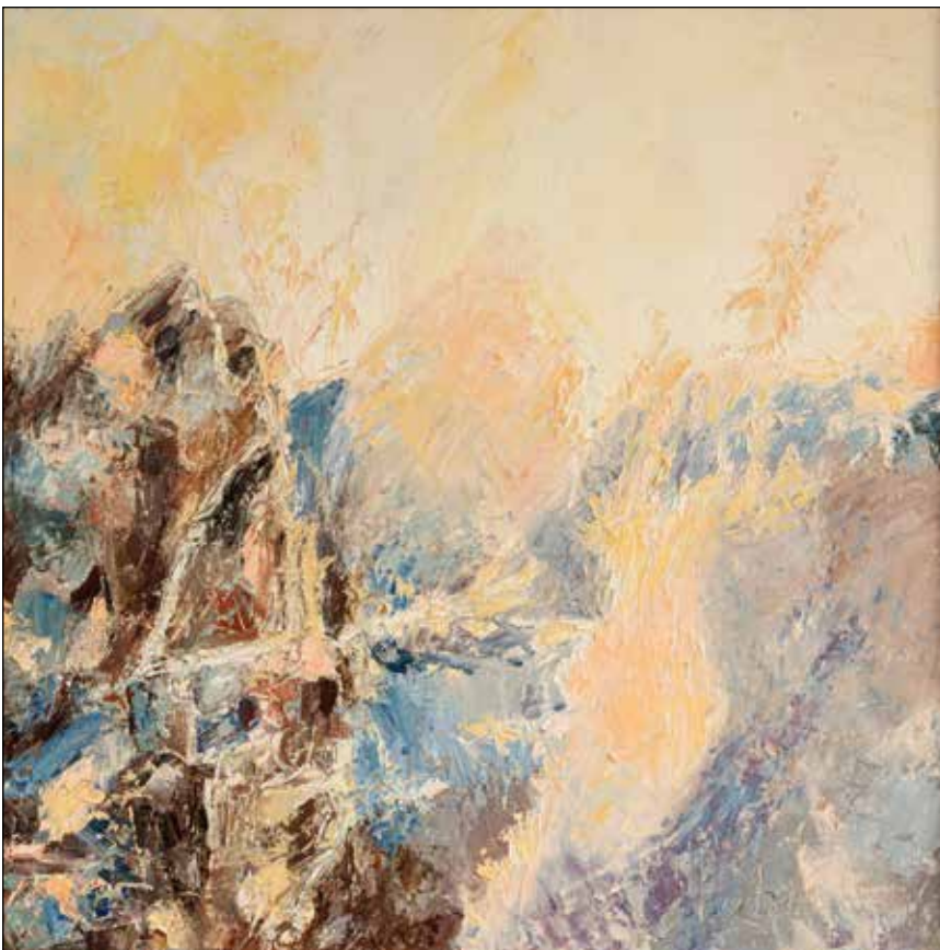
24. Sunce i mraz u sukobu ulje na platnu, 40 x 40 cm, 2011.