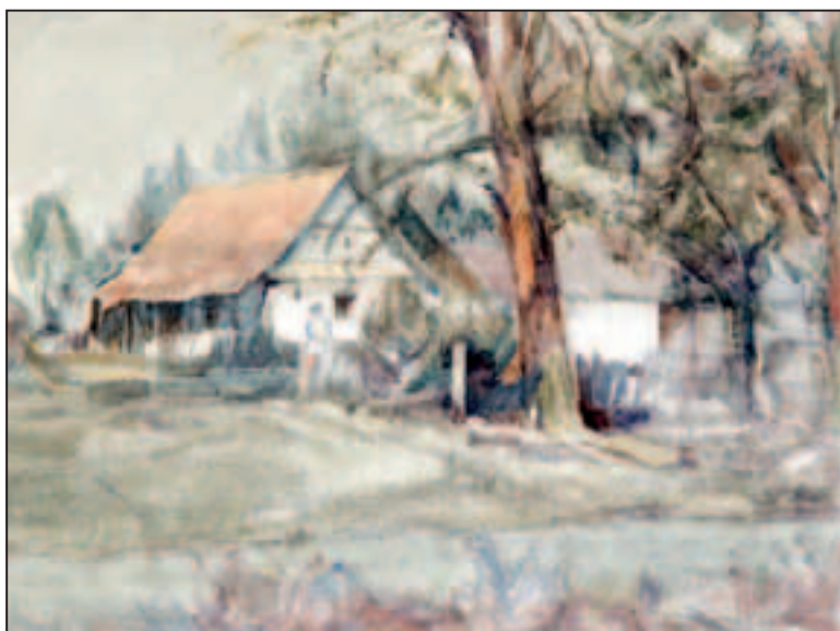
Stan u Slavoniji , akvarel, 44 x 59 cm