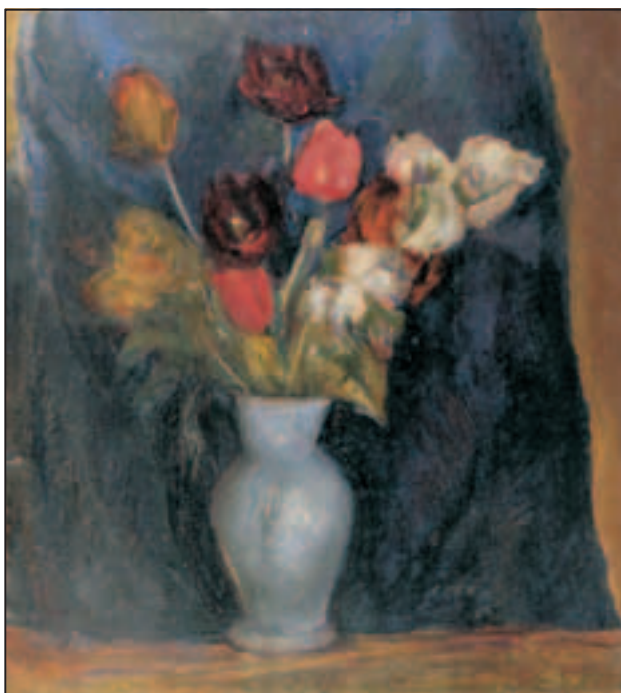
Tulipani , ulje na platnu, 81 x 73 cm