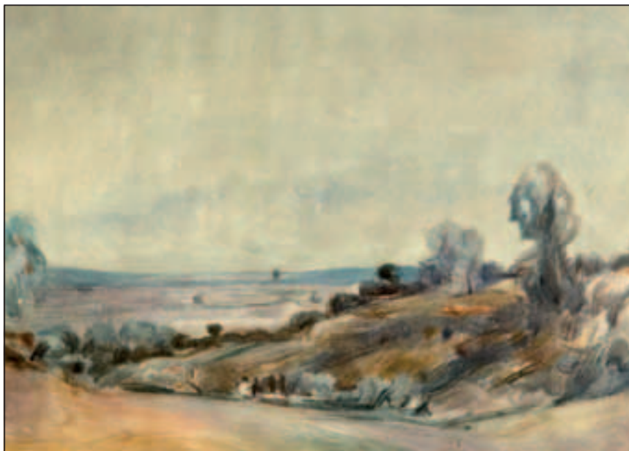
Pejsaž s juga , akvarel, 26 x 36 cm