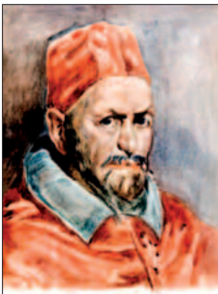
Kardinal , akvarel, 45 x 35 cm