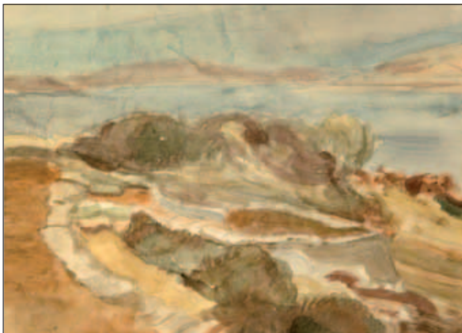
Pejsaž s plavom daljinom , akvarel, 20 x 22 cm