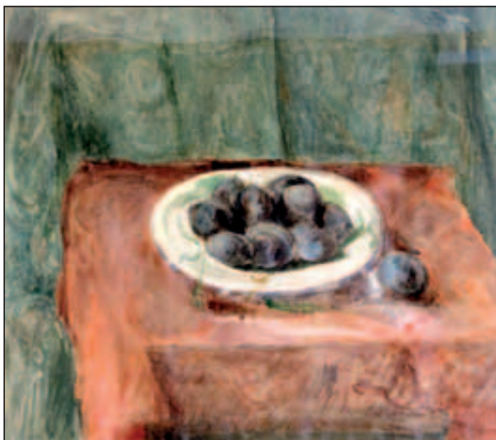
Šljive , akvarel, 57 x 64 cm