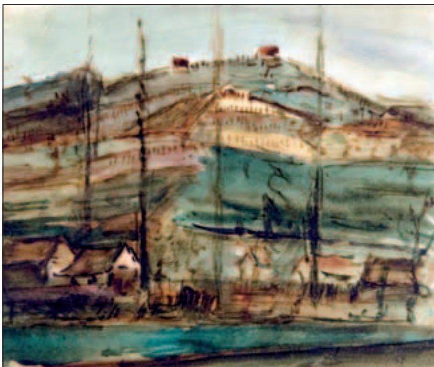
Vinogradi Slavče , akvarel, 27 x 31 cm