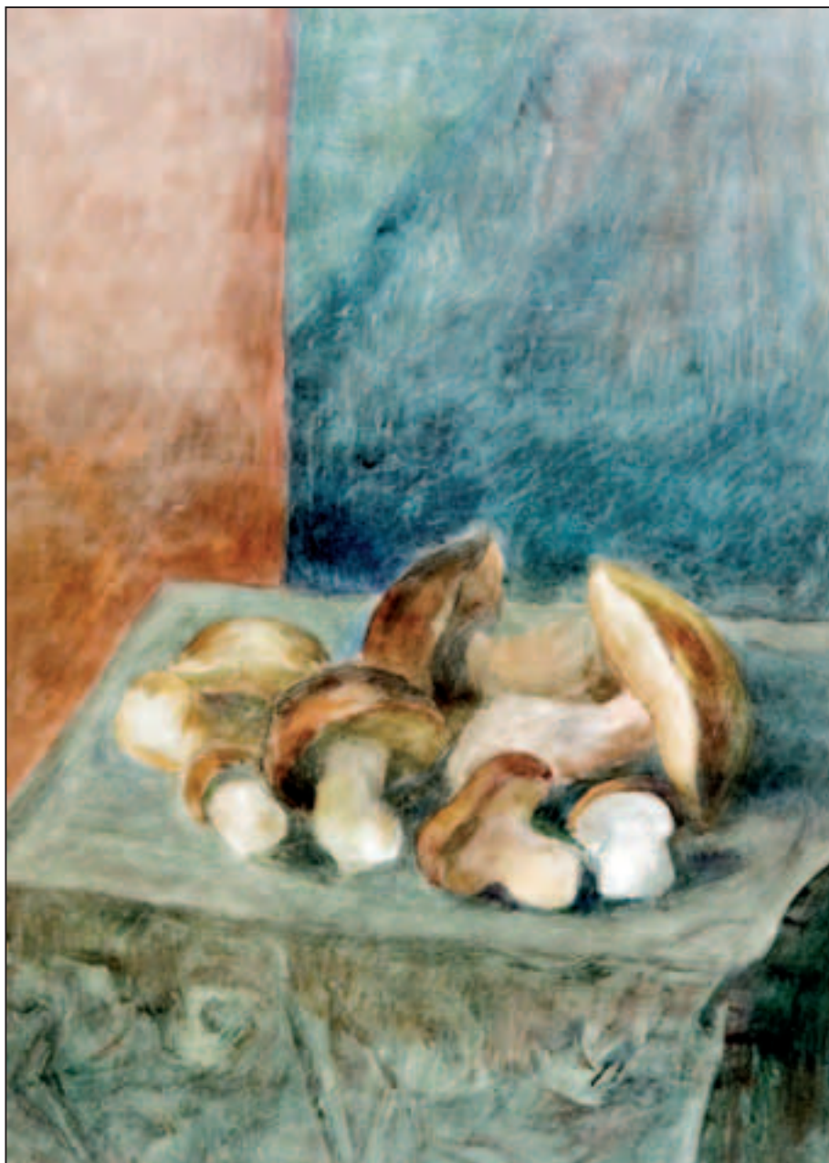
Vrganj , akvarel, 65 x 48 cm