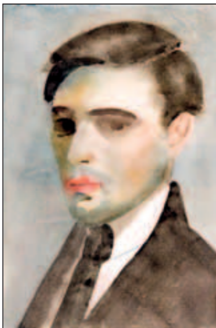
Autoportret , akvarel, 50 x 40 cm