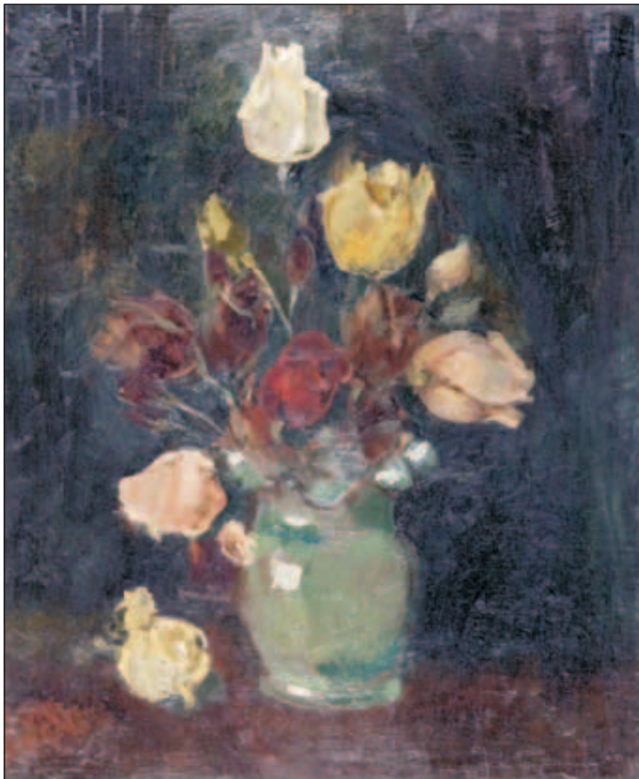
Ruže , ulje na platnu, 51 x 61 cm