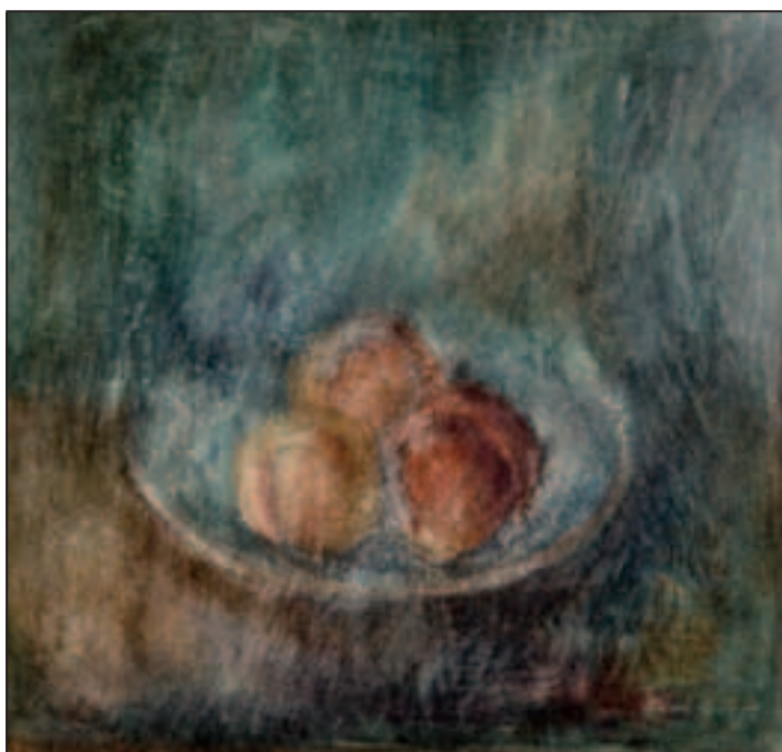
Breskve II , akvarel, 38 x 40 cm