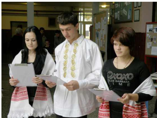
Mladost ognruta tradicijom