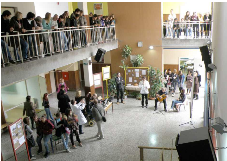
Program u holu škole prate znatiželjni pogledi sa svih strana