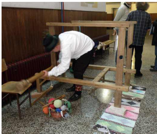
Radionice su završile, tkalac pakuje stvari i putuje kući