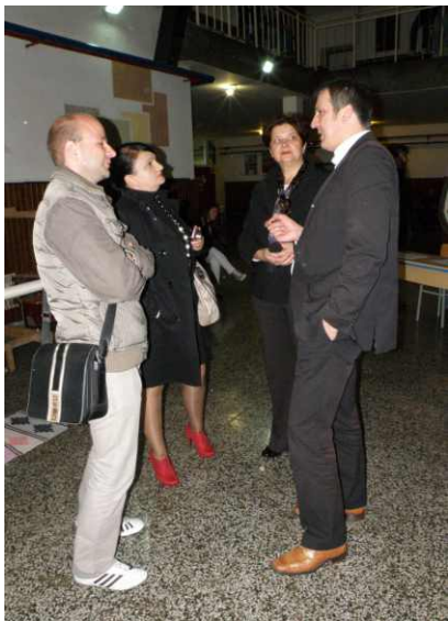
Domaći mediji i ravnatelj škole