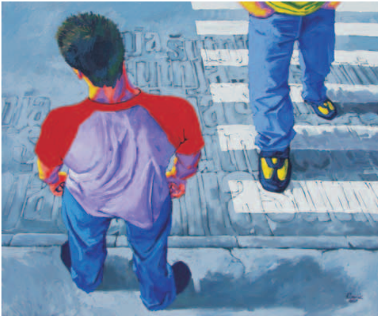
šutnja , 2004. akril na platnu 157 x 187 cm