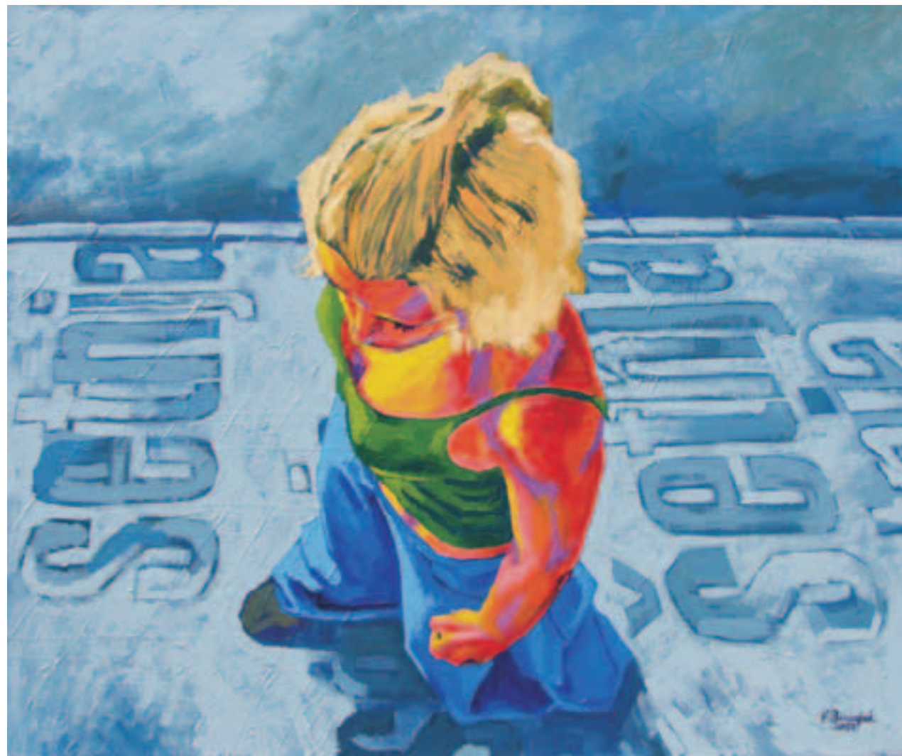
šetnja III, 2004. akril na platnu 100 x 120 cm