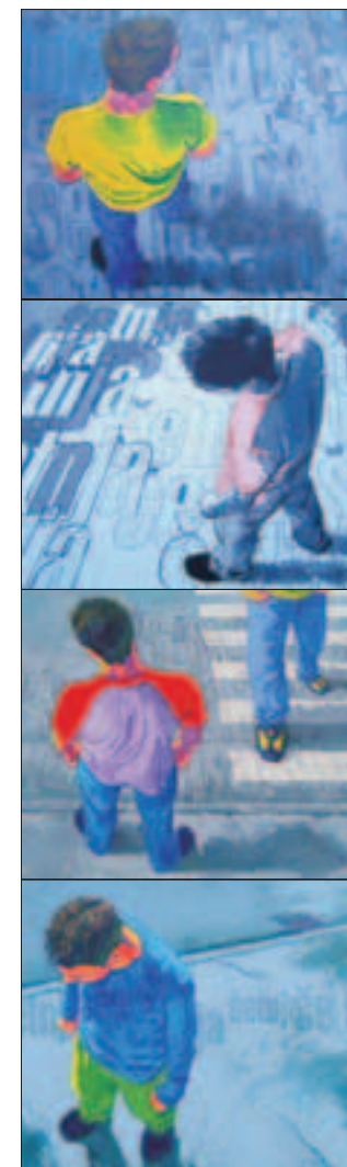
šetnja II, 2004. akril na platnu 130 x 157 cm