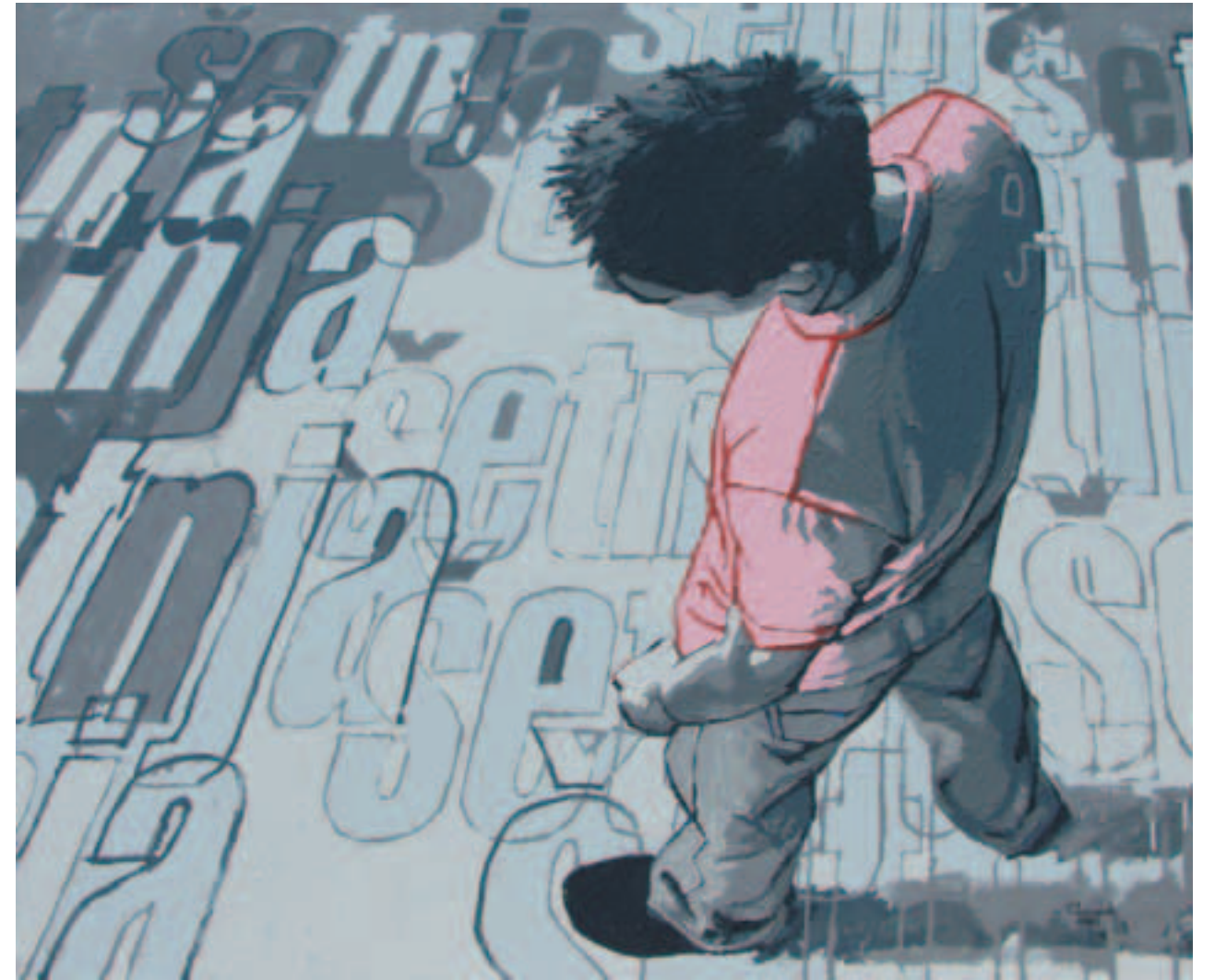
rozna , 2004. akril na platnu 130 x 187 cm