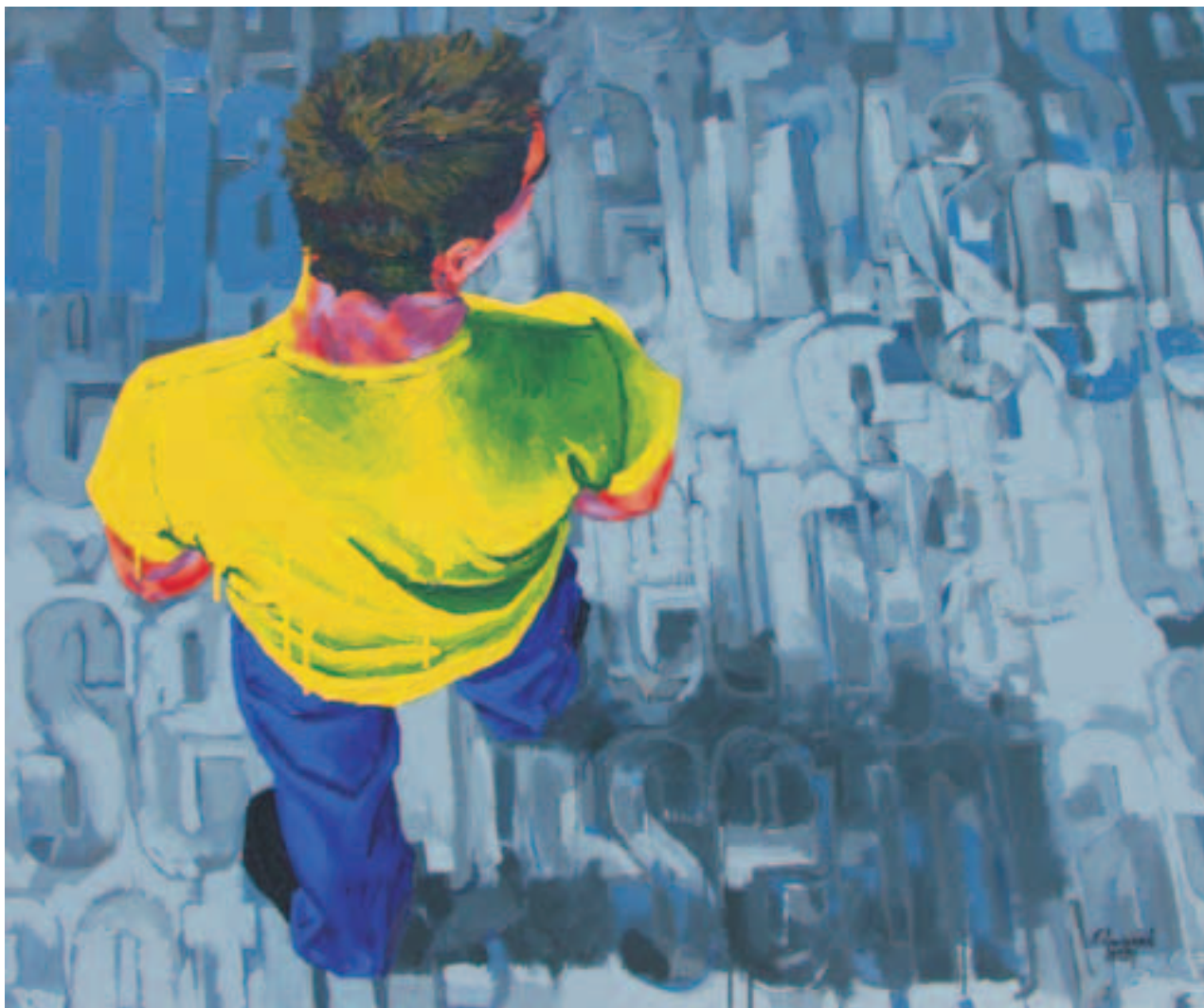
šetnja I, 2003. akril na platnu 130 x 157 cm