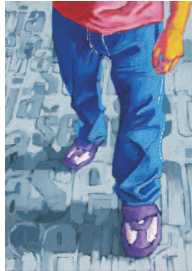
korak , 2003. akril na platnu 100 x 70 cm