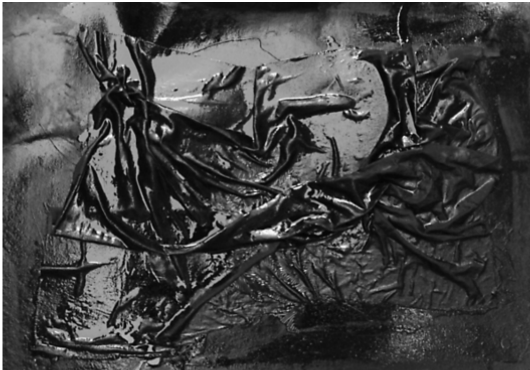
Matija Kralj: iz serije "Kofantregas", kombinirana tehnika, 50 x 70cm