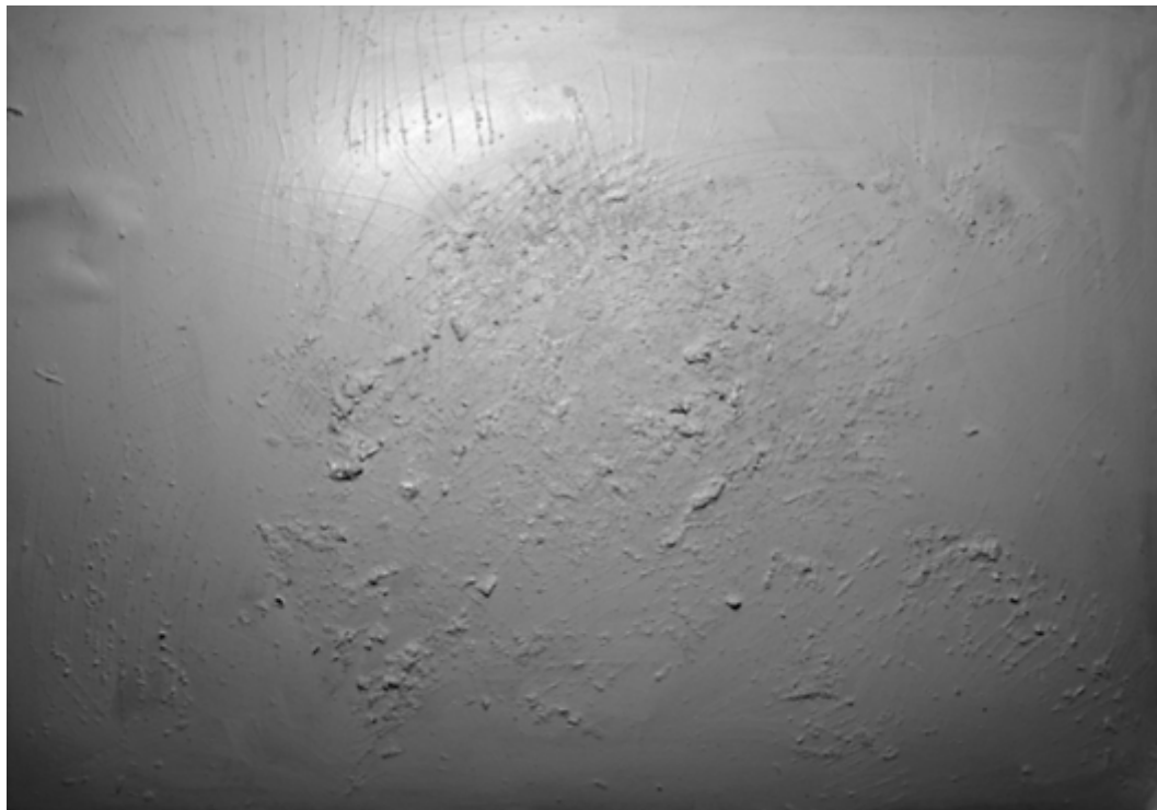
Matija Kralj: iz serije "Kofantregas", kombinirana tehnika, 50 x 70 cm