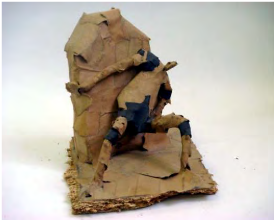
Sanjin Vinković: "Sizif 3" tehnika kaširanog papira, visina cca 30 cm