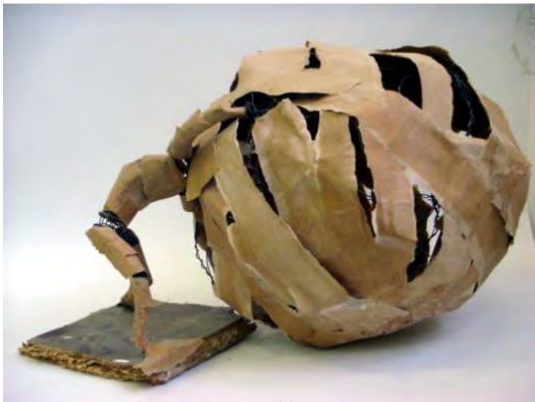
Sanjin Vinković: "Sizif 1" tehnika kaširanog papira, visina cca 30 cm