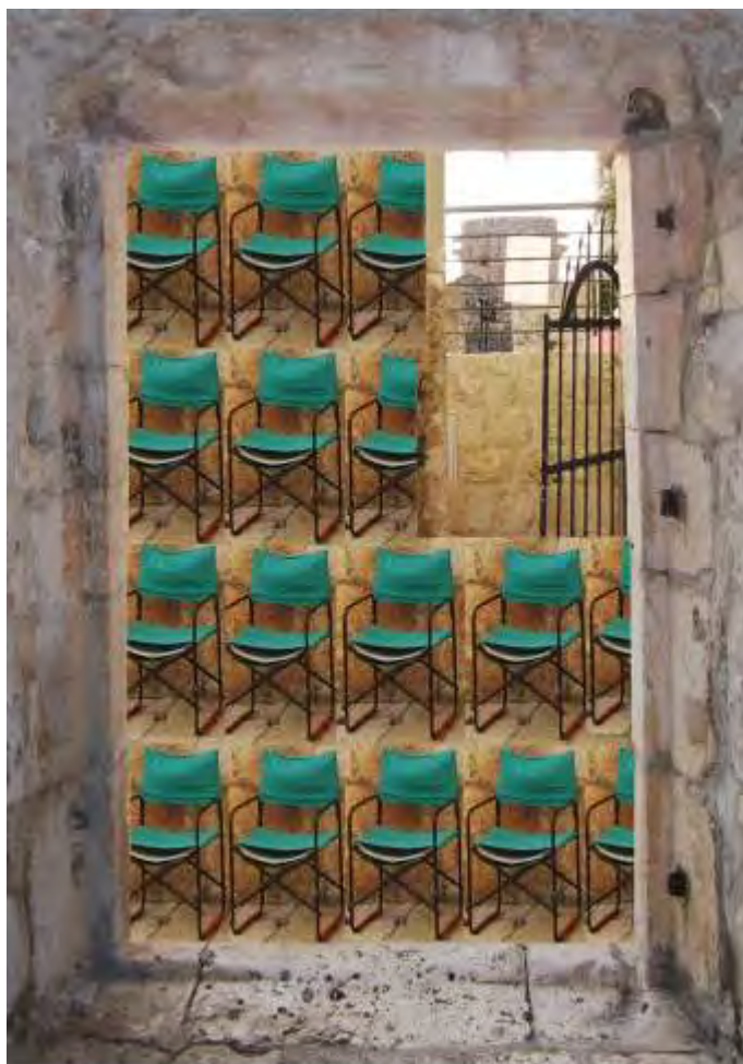
Zrinka Vinković Kralj: "Kompozicija u tri plana", (print), dimenzije 70 x 50 cm