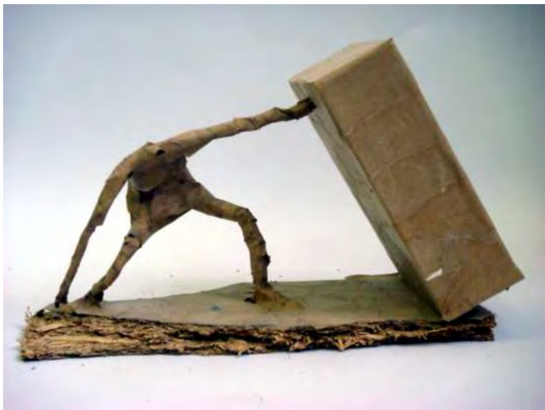
Sanjin Vinković: "Sizif 2" tehnika kaširanog papira, visina cca 30 cm