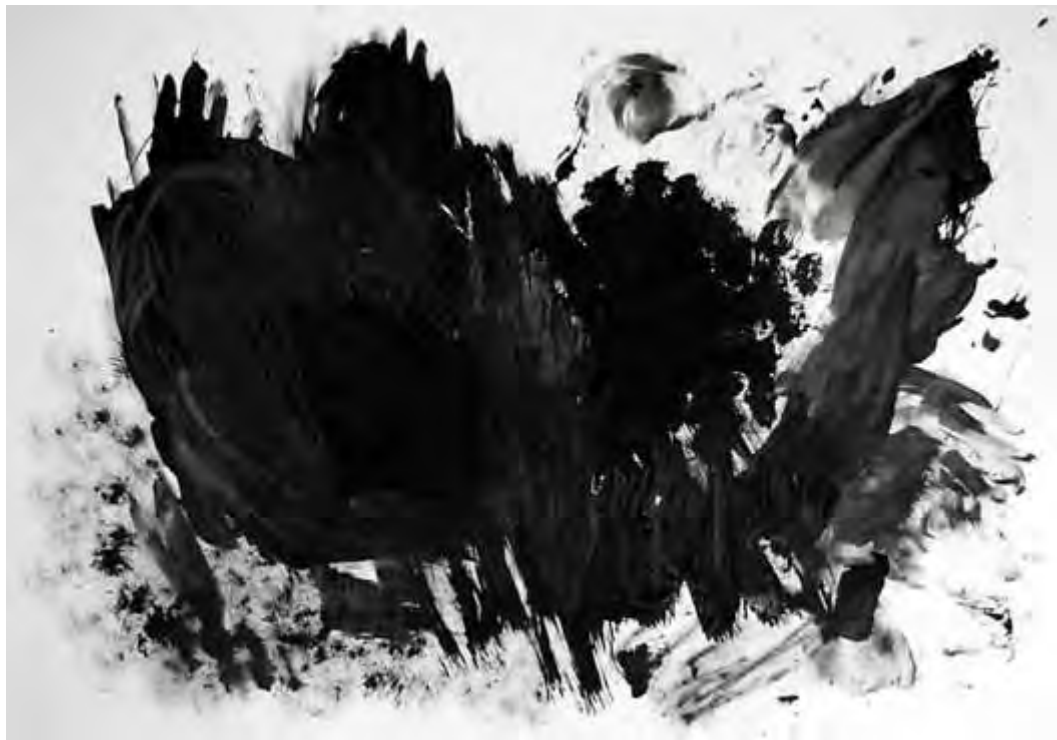
Matija Kralj: iz serije "Kofantregas", kombinirana tehnika, 70 x 100 cm