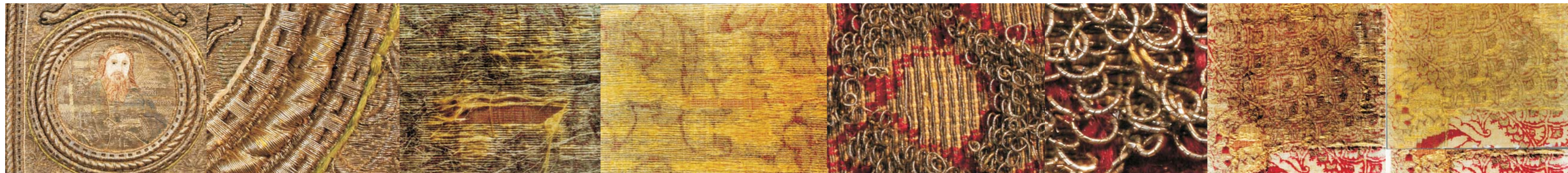
Površina nakon zahvata, detalj

Čišćenje predmeta provodilo se mehaničkim postupkom (mekim kistom i mikro- usisavačem), mokrim postupkom ako su boje postojane (pranjem u kupelji) i suhim postupkom (kemijskim čišćenjem).