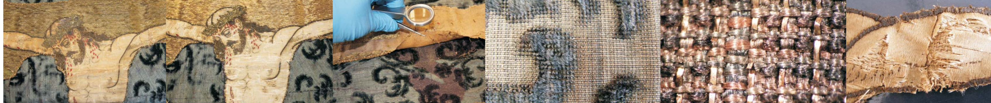
Detalj Krista na križu prije zahvata