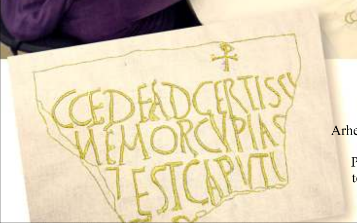
Arheološki nalaz kao predložak za suvenir. Profesorica Marija Vrbanus, tehnika zlatoveza po platnu.