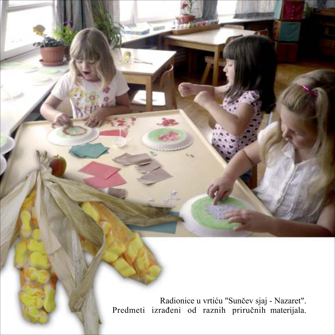
Radionice u vrtiću "Sunčev sjaj - Nazaret". Predmeti izrađeni od raznih priručnih materijala.