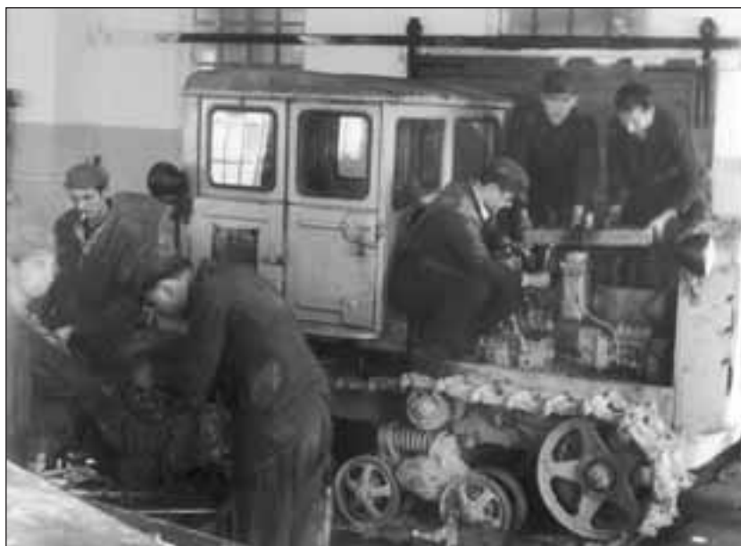
Zajedno smo jači