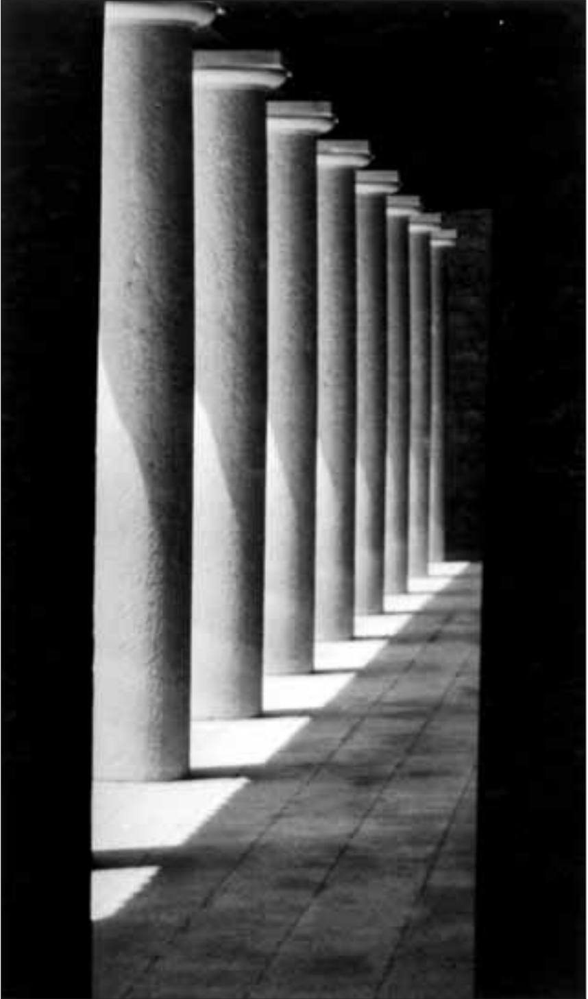
Stupovi u kašteletu