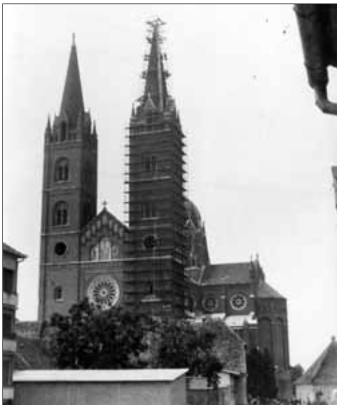
A gdje su ti oči?