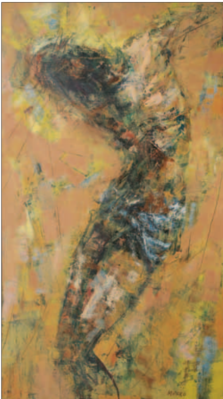
RASPEĆE, 2004., ulje/platno, 122 x 68 cm