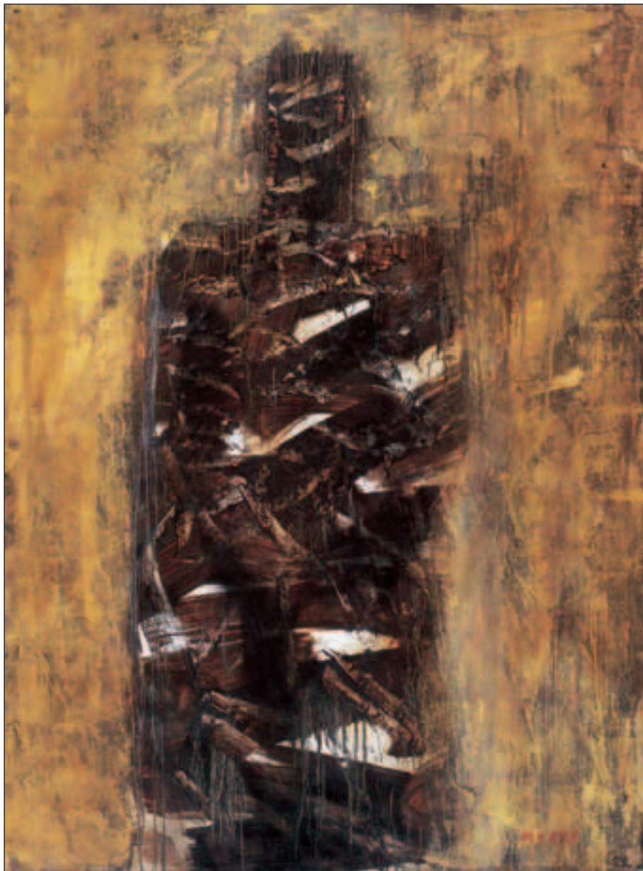
FIGURA, 2002., ulje/platno, 122 x 91 cm