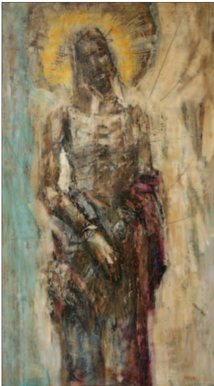
ECCE HOMO, 2007., ulje/platno, 122 x 68 cm