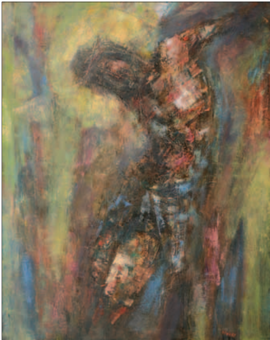
RASPEĆE, 2004., ulje/platno, 100 x 80 cm