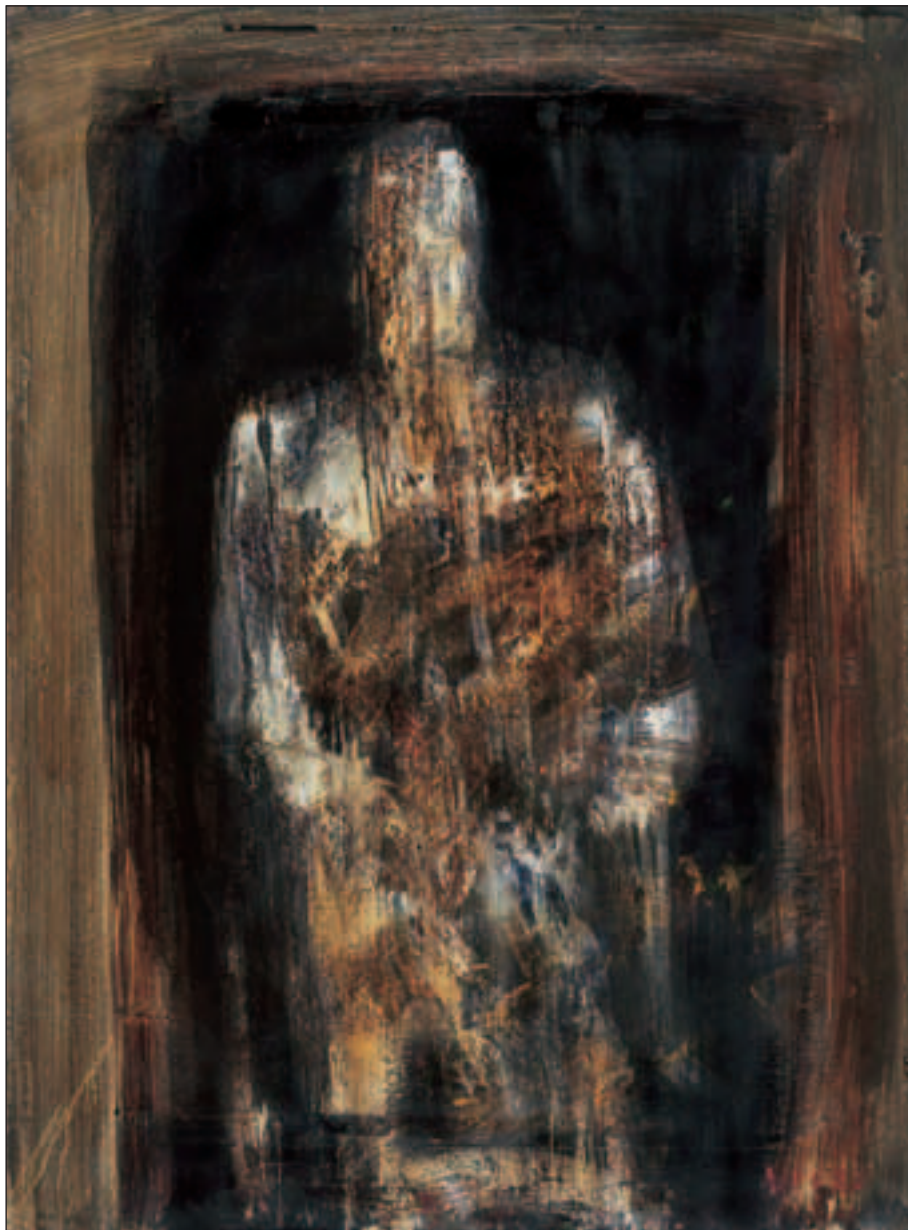
FIGURA, 2002., ulje/platno, 122 x 91 cm