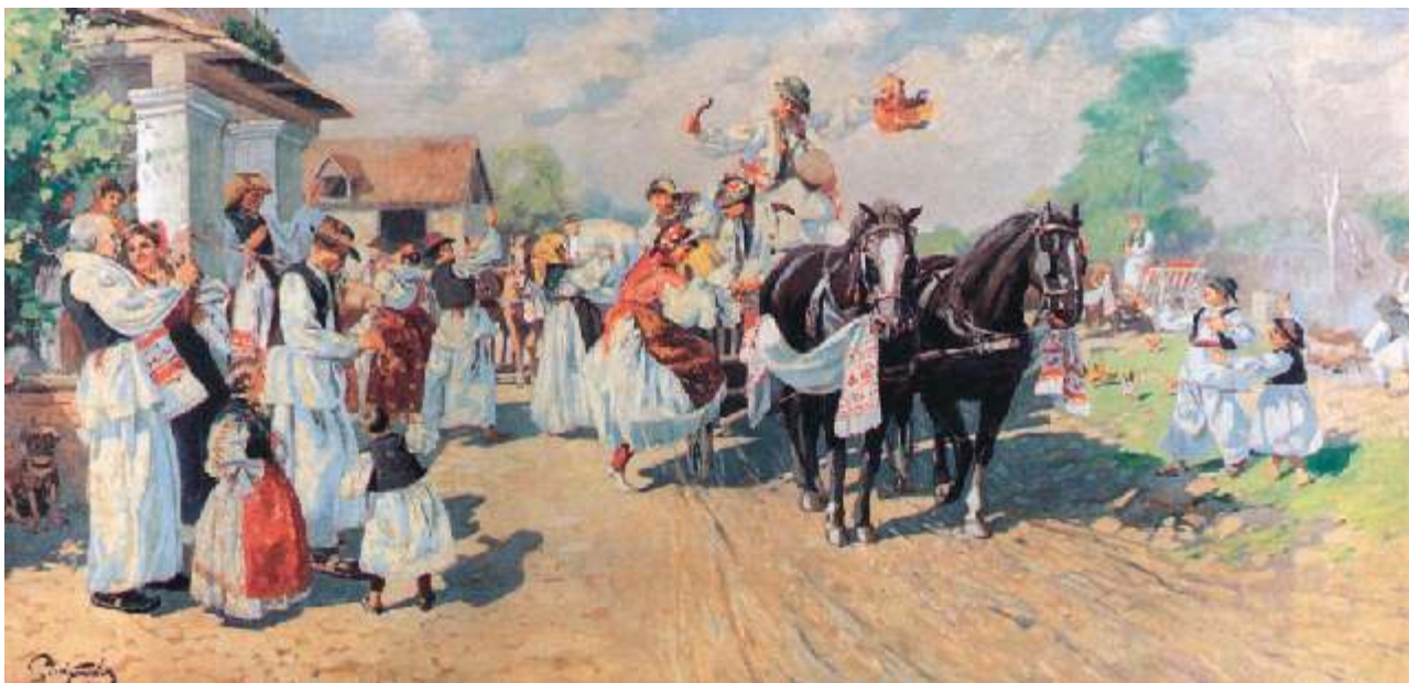
Slavko Tomerlin: Šokački svatovi, ulje na platnu, priv. vlasništvo

Upravo je na takav način prikupljena i građa ove zbirke ručnika. Prateći tehnike izradbe, ukrašavanja i veličinu (duljinu), zapazit ćemo da se ovdje mogu pronaći ručnici jednostavne izrade s nikakvim ili jako skromnim uresima do izrazito dugih, svečanih, bogato ukrašenih različitim vrstama veza i drugih tehnika ukrašavanja. Ručnici su od