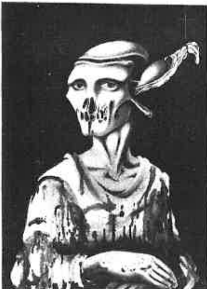
HRVOJE DUVNJAK, cvil I.

LJILJANA ŠKORO fotografkinja, rođena je 1975 godine u Đakovu. Umjetničkom fotografijom bavi se intenzivnije u zadnje dvije godine preferirajući akt i portretnu fotografiju, dvije, usudio bih se reći, najzahtevnije fotografske discipline. Deset izloženih radova imponiraju unutrašnjom tenzijom i suptilnim filingom koji je postignut između ostalog i diskretno naznačenim odmakom od uobičajenih tehničkih rješenja pri izradi fotografija. Do sada nije izlagala.