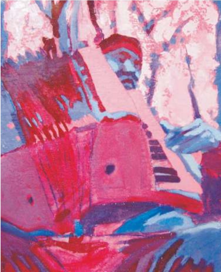
ŽIVOT JE PJESMA 59,5x48,5 cm, kombinirana tehnika