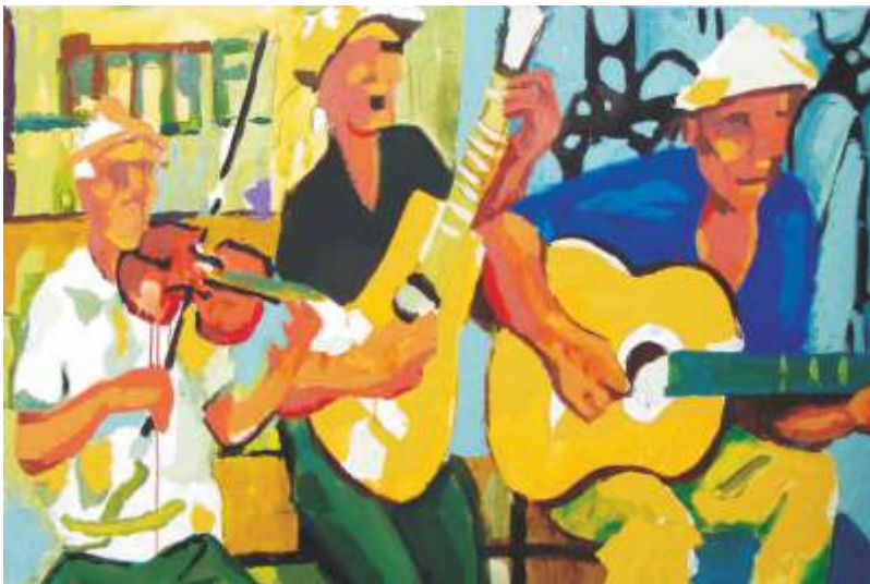
ŽIVOT JE PJESMA 80x120 cm, kombinirana tehnika

Zahvaljujem svima koji su mi pružali podršku svih ovih godina i pomogli u ostvarivanju ove izložbe.