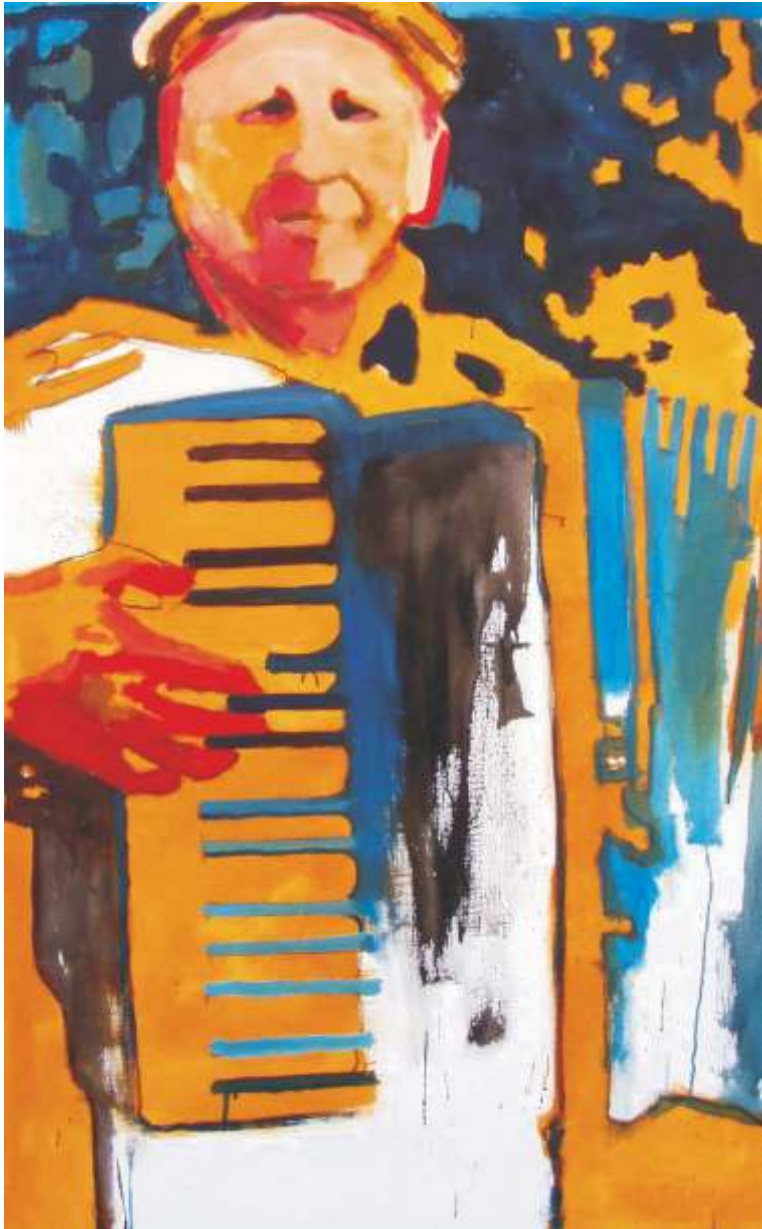
ŽIVOT JE PJESMA 150x100 cm, kombinirana tehnika