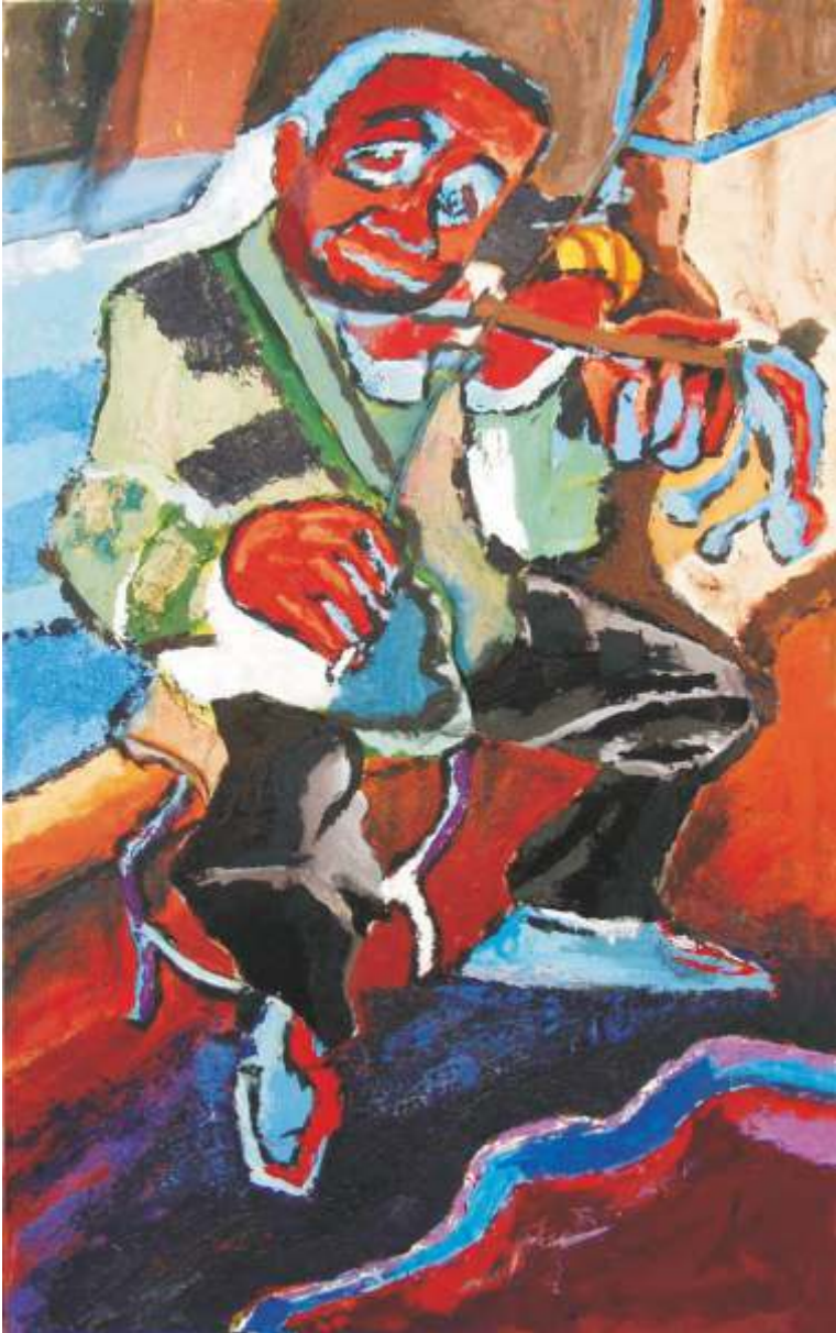
ŽIVOT JE PJESMA 150x90 cm, kombinirana tehnika