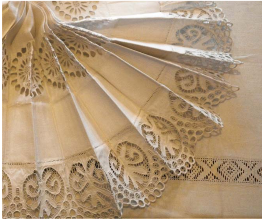
Suknja – čvrsta šlingana rubina na rupe