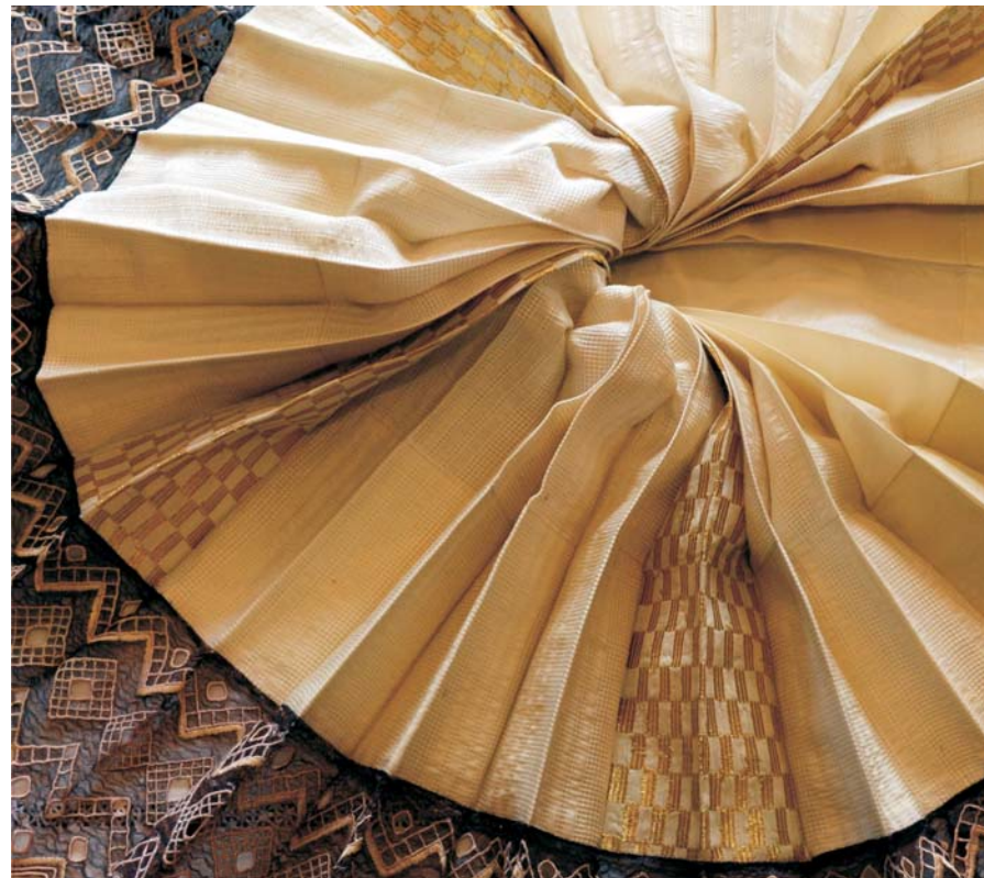
Suknja – zlatom gugana rubina crne čipke

Odrastao je u tradicionalnoj šokačkoj obitelji odakle i potječe njegova ljubav prema tradicijskom ruhu, ali i tradicijskoj baštini. U slobodno vrijeme bavi se očuvanjem, restauriranjem i konzerviranjem tradicijskog ruha i namještaja, a sudjelovao je i na nekoliko manifestacija koje promiču bogatu narodnu baštinu.