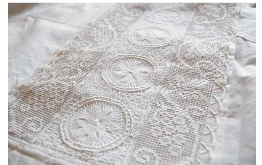
Sunčana čipka - detalj muške košulje